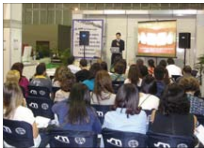
DTSC lecture at CIORJ Congress in Rio de Janeiro. Conferencia del DTSC en el congreso CIORJ, Río de Janeiro.

Dental Tribune Study Club (DTSC), the educational arm of DTI, provides Continuing Education ADA-CERP training courses live at congresses as well as online CE courses on a regular basis. Online CE courses are provided in various languages at DTSC's web page. On September 28 Dr. Edgar García Hurtado will offer a free Spanish-language online lecture entitled "New alternatives to direct restorations using nanoparticle resins in indirect techniques." The new issue of Dental Tribune Hispanic and Latin America publishes an interview on the topic with Dr. García Hurtado (read the article online at www.oemus.com/epaper/dti/4e37b785bfeb3 ). Many DTSC online courses are free. DTSC also presents live educational symposia at major international dental meetings and exhibitions such as IDS, Greater New York Dental Meeting, Moscow, Dubai, etc. Access to the DTSC Symposia in Mexico is free and the live lectures are recorded and archived in the digital library of the educational page so those who could not attend can watch the lectures at their convenience from their clinic or home 24/7. At the FDI World Congress in Mexico