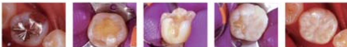
修复前 牙体预备完成 F03垫底 F00注塑充填, 恢复牙尖形态 修复后