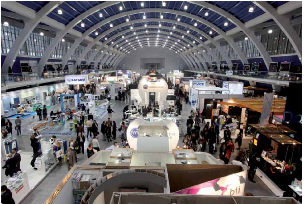
Imagem da Expo-Dentária 2011