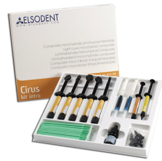
Производител: Elsodent, Франция, от „Дентито“ ООД, зала 2, щанд А19, „Булдентал“