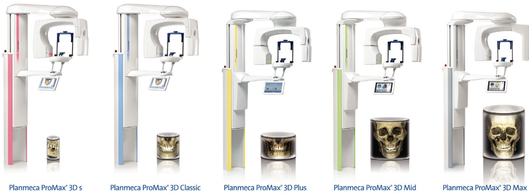
Planmeca ProMax® 3D s

Производител: Planmeca, Финландия, от „ДеМаКом“, зала 2, щанд D1, „Булдентал“