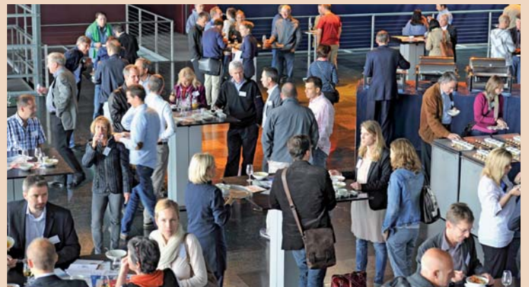
150 Teilnehmer fanden sich am 25. und 26. Mai zum Schmerz-Update im KKL Luzern ein.

schmerzen nach einer Nervdurchtrennung (Wurzelkanalbehandlung, Zahnextraktion) auf. Forscher berichten, dass in 7 bis 12 Prozent nach adäquat durchgeführter Wurzelkanalfüllung persistierende Schmerzen bestehen können. Überraschenderweise liegen die Zahlen bei Weisheitszahnextraktionen deutlich tiefer. In der Diskussion empfahl Dr. Ettl zur Behandlung von lokal persistierenden Schmerzen die Injektion von einem Gemisch aus einem Lokalanästhetikum mit einem kristallinen Steroid (Kenacort 10 mg/ml). Die Medikamentenapplikation kann im Abstand von ein bis zwei Wochen wiederholt werden. Bei eher diffusen Schmerzen empfiehlt sich der Einsatz eines trizyklischen Antidepressivums in niedriger, langsam steigender Dosierung (10 bis 50 mg).