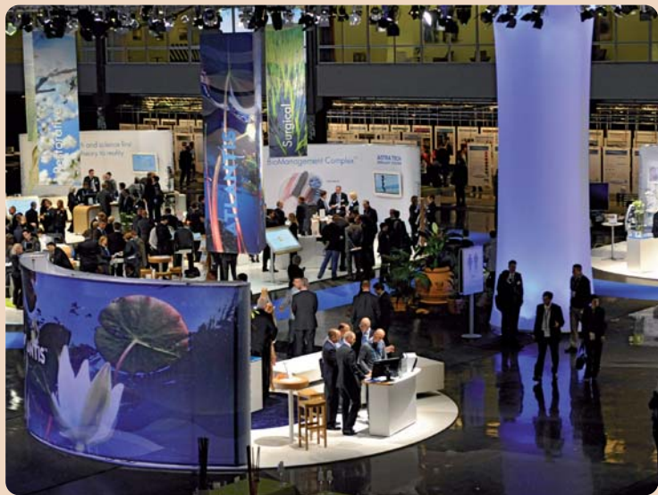
Die Ausstellung wurde als Quelle der Inspiration gestaltet, die Themeninseln durch angelegte Wasserläufe verbunden.

Überlebensraten der ersten Implantate lagen nur bei ungefähr 50 Prozent. Die anfängliche Skepsis der schwedischen Zahnärzte liess sich