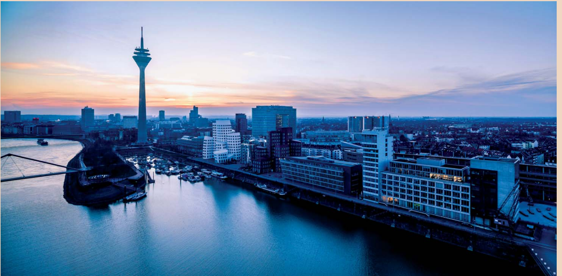
Am 26. und 27. September 2014 findet unter der Themenstellung „Mikroinvasiv – Minimalinvasiv: Integrative Lasertechnologie“ in Düsseldorf die internationale Jahrestagung der DGL statt.

angebotenen Dentallasern ist man in der Lage, alle etablierten Therapieeinsätze durchzuführen. Dass wir im Moment in Deutschland eine etwas