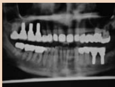
Röntgenkontrolle mit Zirkonimplantaten.