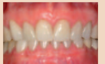
Abb. 3a und b: Dieser 60-jährige Patient war mit der kurzen, abradieren Erscheinung seiner anterioren maxillären Zähne unzufrieden (a). Er hatte einen schweren, protrahierenden Bruxismus entwickelt, der zu schweren Verschleißerscheinungen beider maxillärer und mandibulärer Schneidezähne geführt hatte. Er wurde in eine kieferorthopädische Behandlung überwiesen, um die anteriore Vertikaldimension zu öffnen und damit eine Restauration der abradieren Zähne zu ermöglichen. Die maxillären und mandibulären Schneidezähne wurden intrudiert, sodass Porzellanveneer-Restaurationen platziert werden konnten (b).