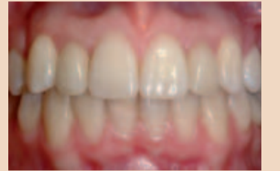
Abb. 1a und b: Bei dieser 15-jährigen Patientin waren beide maxillären lateralen Schneidezähne nicht angelegt (a) und die Eckzähne waren unmittelbar neben den zentralen Schneidezähnen eruptiert. Die kieferorthopädische Behandlung erfolgte durch Extraktion der primären Eckzähne, distale Verschiebung der maxillären Eckzähne in ihre korrekte Position und Platzierung von Implantaten in der Position der maxillären lateralen Schneidezähne. Die Implantate wurden mit Porzellankronen aufgebaut (b), um dem Gebiss ein natürliches Aussehen zu geben.