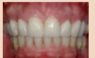
Abb. 4a und b: Dieser 64-jährige Patient war mit dem Aussehen seiner anterioren Zähne unzufrieden (a). Er wies einen flankierenden anterioren Überbiss auf, der zu signifikantem Verschleiß der posterioren Zähne geführt hatte. Mehrere posteriore Zähne fehlten bereits und die Platzierung von Restaurationen auf Implantaten war erst nach Öffnung der posterioren Vertikaldimension möglich. Für diese Therapie war eine koordinierte Behandlung durch einen Kieferorthopäden, Parodontologen, restaurativ arbeitenden Kollegen und Kiefer-/Gesichtschirurgen, also vier verschiedene Spezialisten, erforderlich. Am Ende der Behandlung (b) war der Patient mit dem Endergebnis sehr zufrieden.