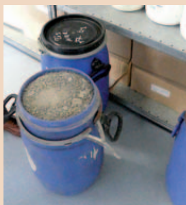
Vorstufe des Recyclings: Getrockneter Amalgamschlamm.

aber auch die Problematik der Leerung und des Recyclings der Auffangbehälter. Einige Hersteller boten zunächst die Möglichkeit der Rücknahme über den Entsorger an. Dies wird jedoch seitens der Hersteller aus Gründen der Hygiene und der Betriebssicherheit nicht mehr unterstützt. Der Transport vom Zahnarzt zum Entsorger wird heute deshalb zum größten Teil mittels geprüfter Verpackungen auf dem Postweg organisiert. „Wir haben jedoch festgestellt, dass es rechtssichere und bessere Möglichkeiten gibt, die Abfälle zu transportieren“, so Dietrich.