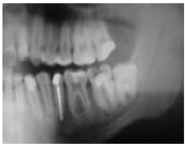
Abb. 2: Ausschnitt von Panoramaschichtaufnahme bei überwiesenen Patienten zur Wurzelspitzenresektion 35, Revision bzw. endochirurgischem Eingriff 37 sowie operativer Entfernung des teiltrinierten Weisheitszahn 38 mit jeweiligem Risiko einer Verletzung des N. alveolaris inferior.