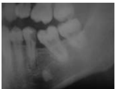
Abb. 5: Apikale Aufhellung an Zahn 35 sowie Verdacht auf Wurzelrest Regio 36.

dar und sind gehäuft Ausgangspunkt von Arzthaftpflichtfällen. Der chirurgisch tätige Zahnarzt wird zwangsläufig gelegentlich mit Nervschädigungen, als seltene, aber typische Komplikation dentoalveolärer Eingriffe, konfrontiert und ist im Falle einer postoperativen Sensibilitätsstörung mit befundadäquatem Handeln gefordert. Dieser Beitrag soll den Blick für iatrogene Nervläsionen schärfen und Auskunft über das Verhalten nach postoperativer Sensibilitätsstörung geben.