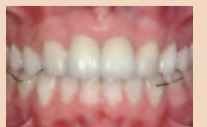
Abb. 5a und b: Dieser siebenjährige Junge hatte zwei makrodonte zentrale Schneidezähne (a), die 12 bzw. 15 mm breit waren. Da es keine Möglichkeit zur Reduzierung der Breite dieser Zähne gab, wurden beide extrahiert, um eine mesiale Eruption der maxillären lateralen Schneidezähne zu ermöglichen. Diese Zähne wurden schließlich mit Porzellankronen aufgebaut, um die fehlenden Schneidezähne zu ersetzen (b). Die Eckzähne und die ersten Prämolaren ersetzen dann die lateralen Schneidezähne bzw. Eckzähne.