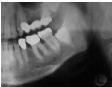
Abb. 1: Weisheitszahn 38 mit fraglicher Beziehung zum Canalis mandibularis.

ESSLINGEN a. N. – Iatrogene Sensibilitätsstörungen des N. alveolaris inferior und des N. lingualis stellen für Patient und Behandler unangenehme Behandlungskomplikationen