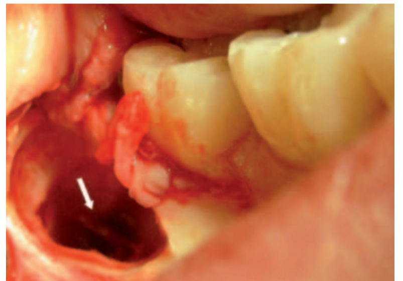
Abb. 7: Operationssitus nach Entfernung des Weisheitszahn 48 bei interradikulärem Nervverlauf.

Prinzipiell können Nervschädigungen bei Weisheitszahnentfernungen durch direktes scharfes oder stumpfes Trauma, postoperative Ödem- und Hämatombildung, durch Lokalanästhesie sowie durch Wundinfektion verursacht werden. Eine Kontinuitätstrennung (Neurotmesis) des N. alveolaris inferior sowie des N. lingualis ist durch Abgleiten mit (rotierenden) Instrumenten möglich. Bei einer Luxation des Zahnes kann der N. alveolaris inferior stumpf traumatisiert werden. Eine Beeinträchtigung des N. lingualis allein durch die Elevation des lingualen Periosts mit dem Raspatorium ist ebenfalls möglich. Eine Schädigung des N. alveolaris inferior bzw. des N. lingualis durch die Lokalanästhesie am Foramen mandibulae durch eine intraneurale Injektion oder durch Verletzung mit der Kanülenspitze wird als äußerst seltenes Ereignis angesehen. Der Operateur schuldet dem Patienten eine umsichtige und eine am aktuellen Stand der Wissenschaft orientierte operative Entfernung der Weisheitszähne. Eine digitale Volumetomografie als erweiterte Röntgendiagnostik kann im Einzelfall bei fraglicher Beziehung zum Mandibularkanal die operative Planung verbessern, jedoch bleiben bei dentoalveolären Operationen in Nervnähe Schädigungen des N. alveolaris inferior und des N. lingualis ein typisches, operationsbedingtes Risiko (siehe Abbildung 7). Darüber hinaus sind zahnärztlich-chirurgische Eingriffe, wie orthograde und retro-