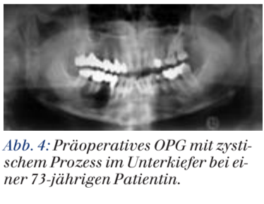
Abb. 4: Präoperatives OPG mit zystischem Prozess im Unterkiefer bei einer 73-jährigen Patientin.