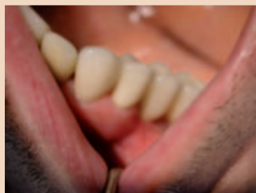
Detailansicht Zirkonkrone auf Zirkonimplantat.