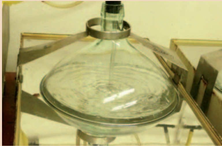
Destillierglocke und Behandlungsbecken bei der GMR.