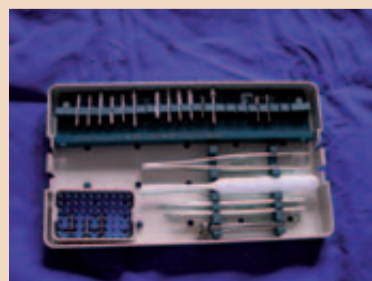
Instrumententray mit Keramikbohrern und Keramikinstrumenten.