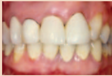
Abb. 6 a und b: Diese 38-jährige Patientin war mit dem Erscheinungsbild ihrer oberen Frontzähne unzufrieden (a). Der maxilläre linke laterale Schneidezahn war nicht angelegt und der maxilläre rechte und linke zentrale sowie der rechte laterale Schneidezahn wiesen kurze Wurzeln und einen signifikanten Knochenverlust auf und galten als nicht erhaltbar. Die Behandlung der Patientin erfolgte durch kieferorthopädische Extrusion und nachfolgende Extraktion der maxillären zentralen Schneidezähne, um so vertikale Knochensubstanz für die Platzierung von Implantaten zu gewinnen. Diese Implantate ersetzten beide zentralen Schneidezähne (b), eine einseitig verspannte Brücke ersetzte den maxillären rechten lateralen Schneidezahn.

Denken Sie, dass die linguale „ästhetische“ Kieferorthopädie sich zur Standardtherapie entwickeln wird? Wie denken Sie persönlich darüber?