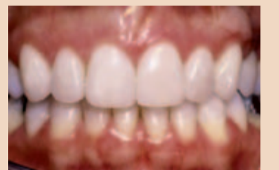
Abb. 2a und b: Eine 38-jährige Patientin war mit dem Erscheinungsbild ihrer maxillären Schneidezähne unzufrieden. Der rechte zentrale und laterale Schneidezahn sowie der rechte Eckzahn waren kürzer (a) als die entsprechenden Zähne auf der linken Seite. Die labiale Sulkustiefe aller Zähne betrug einen Millimeter, wobei die Zahnschmelzgrenze an der unteren Begrenzung des Sulkus lag. Die Ursache für ihr Problem war ein rechtsseitiger protrahierender Bruxismus, der zum Verschleiß der Schneidezähne und kompensatorischer Eruption der anterioren rechten Zähne geführt hatte. Die Behandlung erfolgte durch kieferorthopädische Intrusion der verkürzten Zähne und nachfolgende Restauration der Schneidekanten mit Porzellanveneers (b), um dem Gebiss ein natürliches Aussehen zu geben.