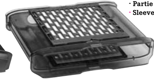
· Partie support. · Rack portion.