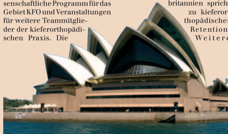
In Sydney treffen sich Kieferorthopäden aus aller Welt.

Schwerpunkte sind das wissenschaftliche Programm für das Gebiet KFO und Veranstaltungen für weitere Teammitglieder der kieferorthopädischen Praxis. Die