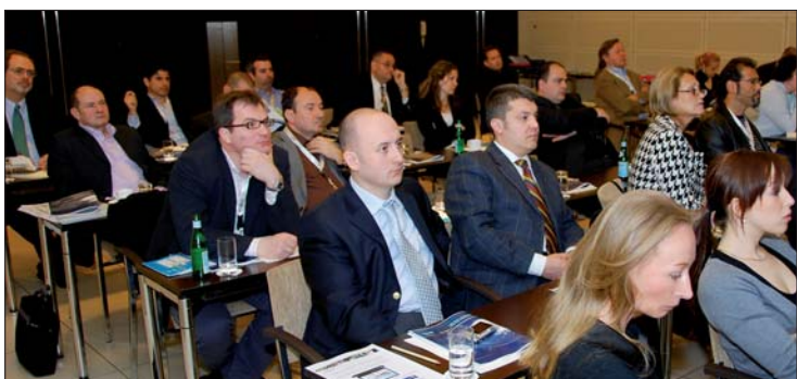
♦ DTI Lizenzpartnertreffen 2009. ♦ DTI Licence partner meeting in 2009.

Neue Partner und Projekte auf Lizenznehmertreffen in Köln vorgestellt New partner and projects revealed at Annual Publishers Meeting in Cologne