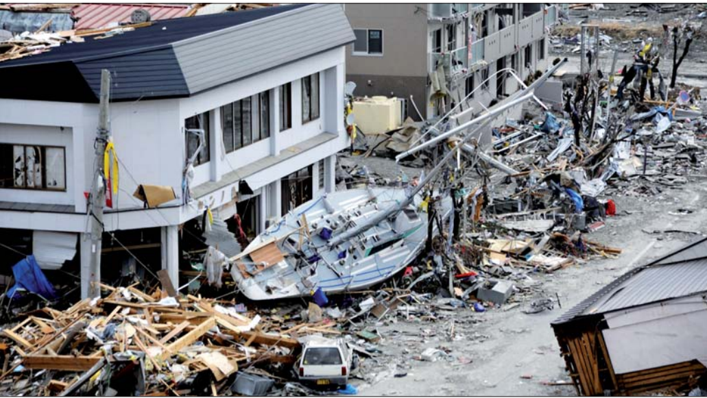
• Trümmer im Fischereihafen von Ofunato, 15. März 2011. • Debris covers the fishing port of Ofunato, Japan, March 15, 2011.

Zwei Prozent der IDS-Umsätze sollen direkt an „Aktionsbündnis Katastrophenhilfe“ gehen German dental manufacturer donates two per cent of its revenue at IDS to relief network