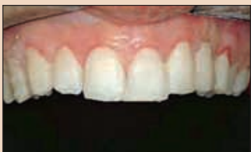
Фиг. 18. Завършеното редуциране на режещите ръбове през ВКПОЕ.

нални аспекти на планираните фасети, е че представяват чудесен ориентир при препарирането на зъбите.