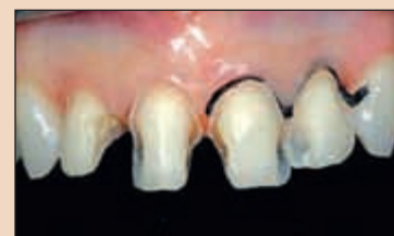
Фиг. 4б. След като се завърши същото препазиране, се отстраняват наличните остатъци от композит и препазиционните граници се заоблят, с което приключва изпиляването.