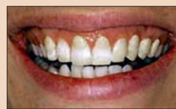
Фиг. 9. Първо се оформят режещите ръбове и се определя тяхната позиция с помощта на композитни наслявания. След това върху меките тъкани се добавя материал, за да се определи каква ще е позицията на меките тъкани след пародонталната хирургия. Междувременно се определя съотношението между височината и ширината на зъбите.