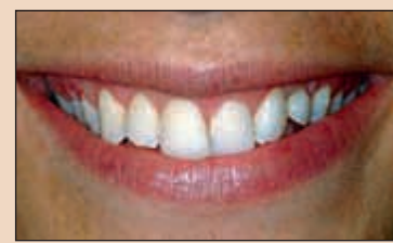
Фиг. 11. След удължаването на коронките зъбите се избелват. Забележете променените гингивални контури.