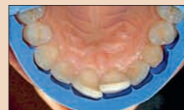
Фиг. 13. По восъчния моделаж се изработва силиконов индикатор (СИ), който ни ориентира по време на препарационната фаза. СИ се ажустира върху зъбите. Забележете, че той не може да бъде поставен пасивно върху зъбната дъга, поради протрудираната позиция на медиоинцизалната фаціальна повърхност на зъб 11.