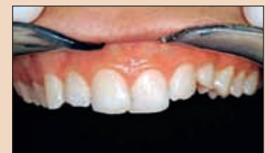
Фиг. 6. Неестетичният изглед на усмивката със сравнително тъмни, къси корони, неравни гингивални граници, струпване на резците, неравномерен силует на режещите ръбове и млечен канин във втори квадрант.

Третият параметър, който трябва да се разглежда при анализа на естетиката, е ЕОР. Това може да се направи лесно при сагитален изглед, като при конкретната пациентка се вижда персистиращ млечен канин горе вляво (зъб # 63), което създава проблем по отношение на ЕОР, тъй като тя се скъсява във вертикална посока (Фиг. 8). На този етап предпочитам