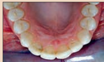
Фиг. 1в. Големи композитни обтуриации и кавитация от палатинално.