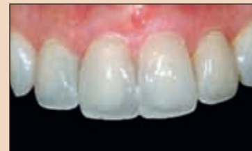
Фиг. 5. Предварително изработени пластинкови пробирни възстановявания, които са ажустирани в устата, след което са запълнени с композит и са фиксирани временно към препазираните зъби.