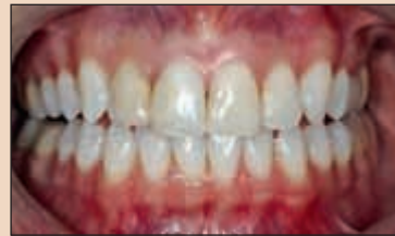
Фиг. 1б. Зъбите са избелени. Забележете разликата в цвета между избелените зъбни тъкани на резците и наличните композитни възстановявания.