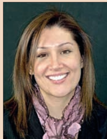
Фиг. 2в. Цялостната усмивка и интегрирането ѝ с лицето.