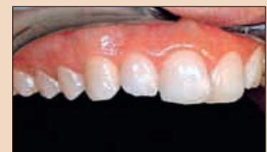
Фиг. 7. Анализиране на усмивката в странична проекция, което показва струпването при централите.