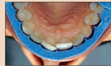
Фиг. 14. При такива ситуации се прави предварително естетично реконтуриране (ПЕР). Протрудираните повърхности на зъбите, разположени по-вестибуларно спрямо определените финални контури на окончателните полифасетни възстановявания се изпилват, така че силиконовият индикатор да се поставя пасивно върху зъбната дъга. Забележете изпиления медиоинцизален ъгъл на зъб 11 и пасивната позиция на СИ върху зъбната дъга след ЕПР. За да се оцени крайният резултат от предложения нов дизайн на усмивката, трябва да се изпробват временните конструиращи за предварително оценяване на естетиката (ВКПОЕ).