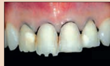
Фиг. 4а. Последни се редуцират инцизалните ръбове. Първо се задава необходимата дълбочина с цилиндрично борче по избор чрез създаването на няколко улея, които в последствие се свързват едни с други.