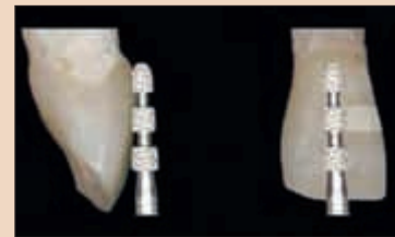
Илюстрация. Стандартно зъбно препазиране.