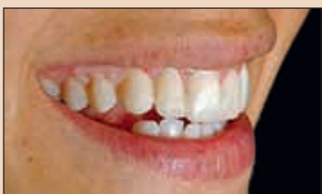
Фиг. 16. Визуализиране на завършения дизайн на усмивката преди да са препарирани зъбите чрез поставянето на ВКПОЕ. Временните конструкции трябва да са точно копие по отношение контурите, структурата и формата на завършените полифасетни възстановявания.

Хубавото при ВКПОЕ, освен възможностите за оценяване на естетичните и функцио-