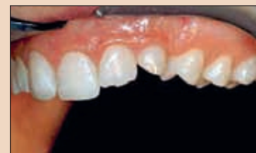
Фиг. 8. От този ъгъл лесно може да се оцени естетичната оклузална равнина (ЕОР). Ясно се вижда изместването ѝ нагоре в областта на канина.