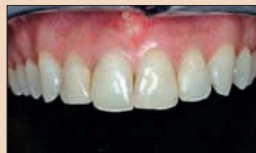
Фиг. 1а. Зъби с големи композитни възстановявания.