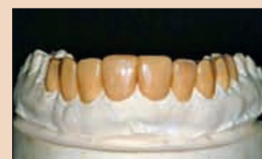
Фиг. 12. Окончателното моделиране с восък.

Оформяме внимателно гингивалните ръбове и това, което се получава, е точно копие на очаквания краен лечебен резултат от керамичните изграждания, само че постигнат с пластмаса. Сега е най-подходящият момент да попитаме пациента за мнението му по отношение на естетичния резултат (Фиг. 16). Могат да бъдат лесно оценени опората за устната, която придават възстановяванията и естетичната дължина, като те трябва да бъдат одобрени и от пациента. Също така трябва да се разгледат функционалните движения на пациента и да се провери дали се създават блокажи във фронта. Обръща се внимание и на фонетиката,