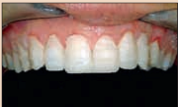
Фиг. 17. Тъй като ВКПОЕ съответстват на точните фаціальни контури на предложения дизайн на усмивката, зъбната подготовка може да бъде направена през тях. Това ще даде на зъболекаря и на зъботехника точна представа за обема, който трябва да се редуцира, така че да се постигне минимална инвазивност.