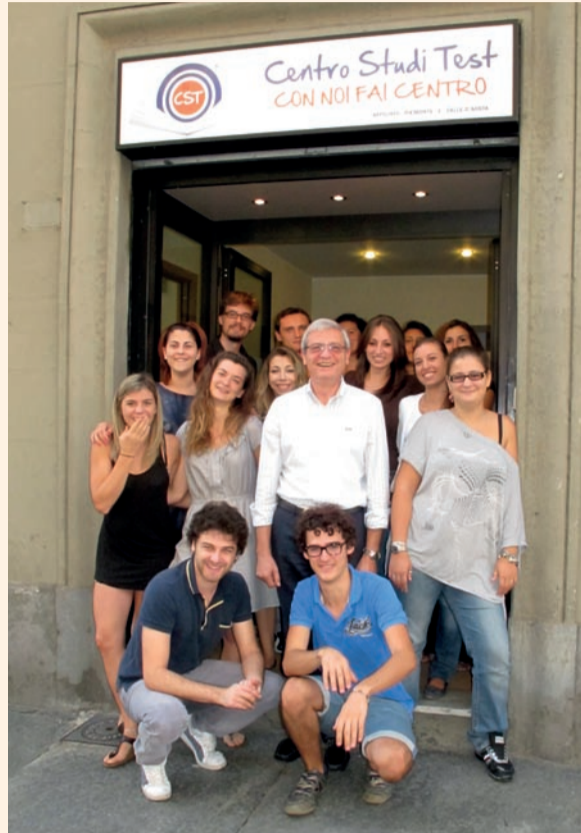
Alcuni "candidati" all'ammissione alle Facoltà a numero chiuso con il titolare del Centro Studi Test di Torino.

gazzi in Italia parteciperanno nel prossimo settembre alle prove di ammissione alle Facoltà a nume-