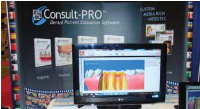
• Des outils éducatifs pour les patients sont offerts au kiosque de Consult-Pro (no. 1511) • Patient education tools are on display at the Consult-PRO booth (No. 1511).