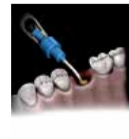
Διατήρηση Μετεξακτικού Φατνίου