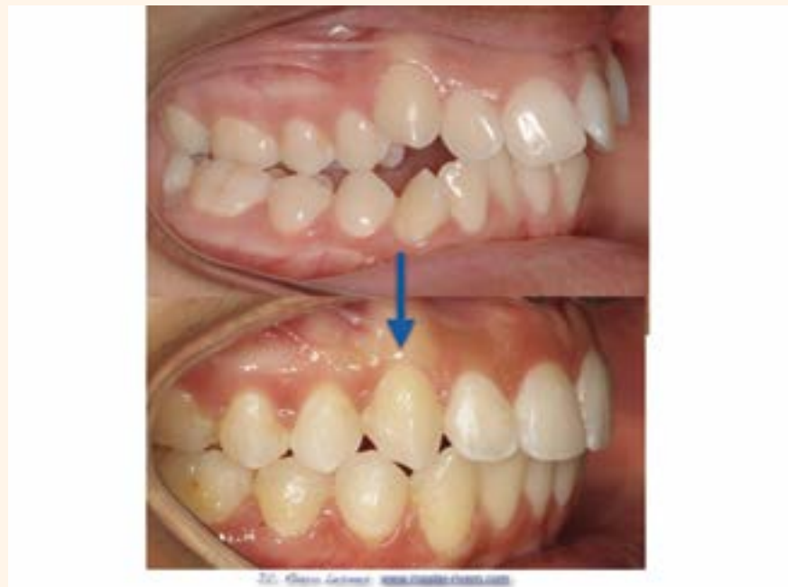
Figura 4. Caso 2.