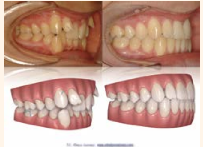
Figura 2. Caso 1.