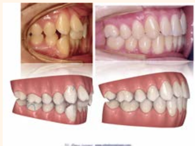
Figura 3. Caso 1.