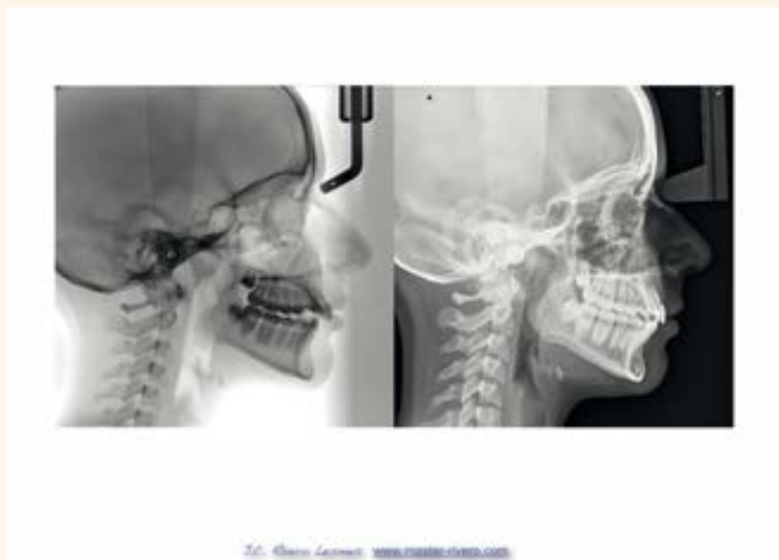
Figura 7. Caso 2.