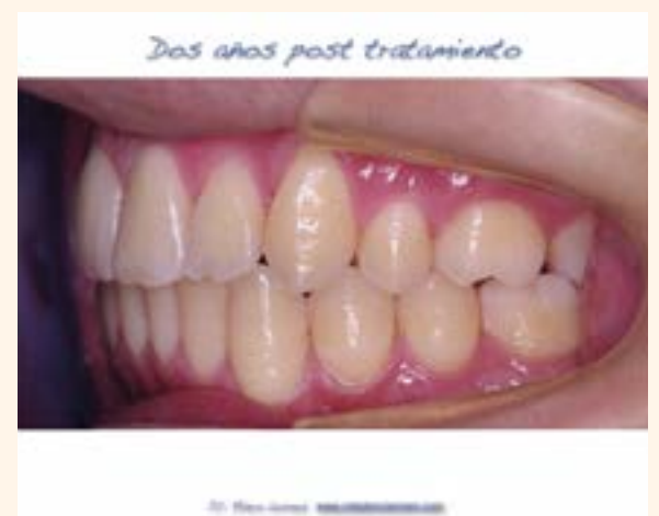
Figura 9. Caso 1.

decía que “el principal obstáculo para el avance de la humanidad es la fuerza de la costumbre del propio ser humano”.