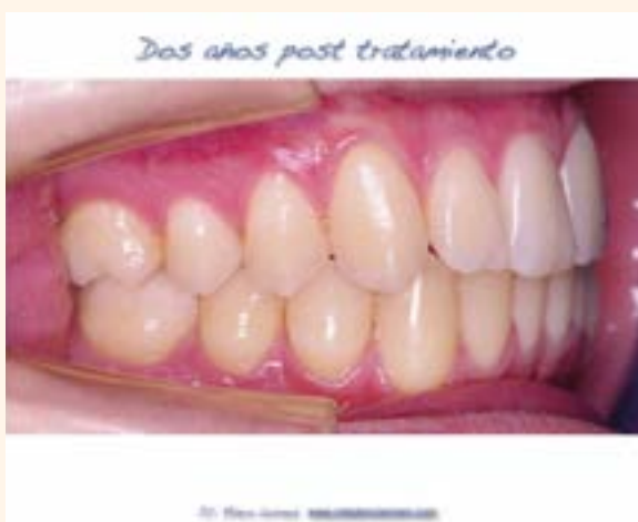
Figura 7. Caso 1.