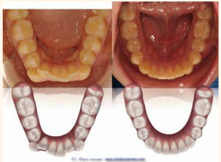
Figura 6. Caso 1.