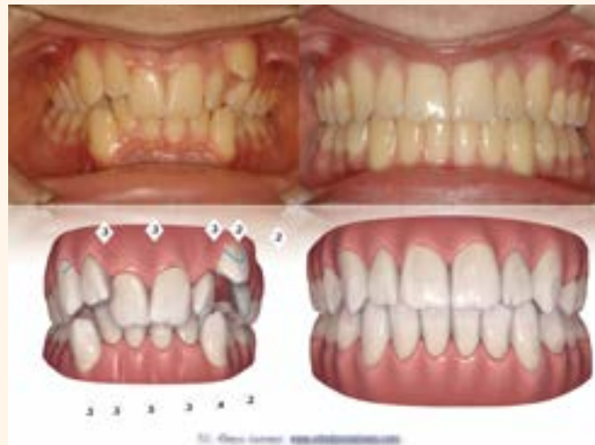
Figura 1. Caso 1.

En el 2003, publicábamos un artículo de opinión donde citábamos a John Stuart Mill (1806-1873) cuando