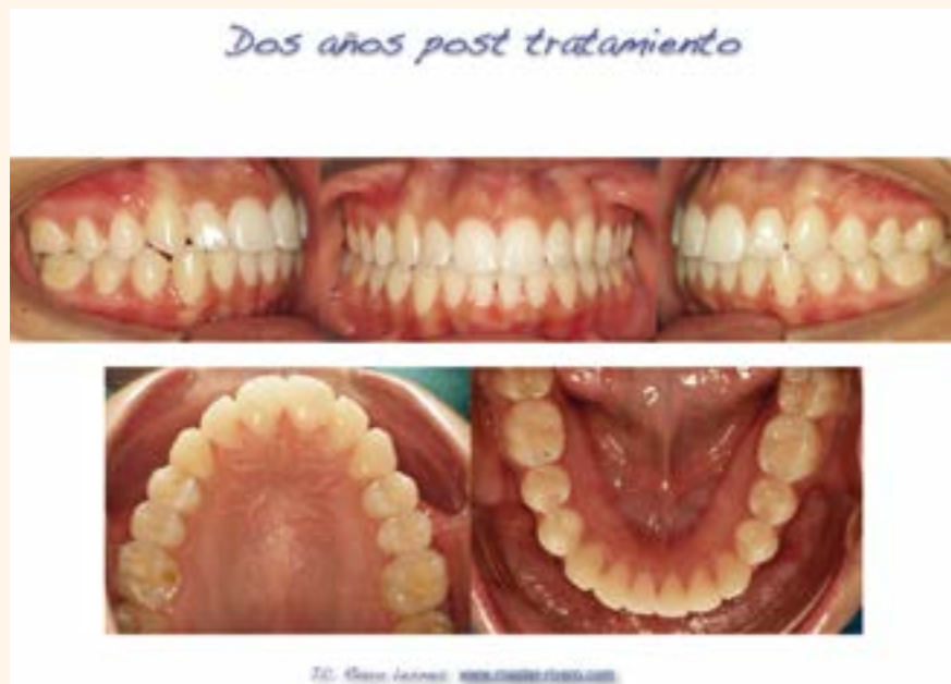
Figura 8. Caso 2.

poder contrastar resultados a corto y, mucho menos, a largo plazo.