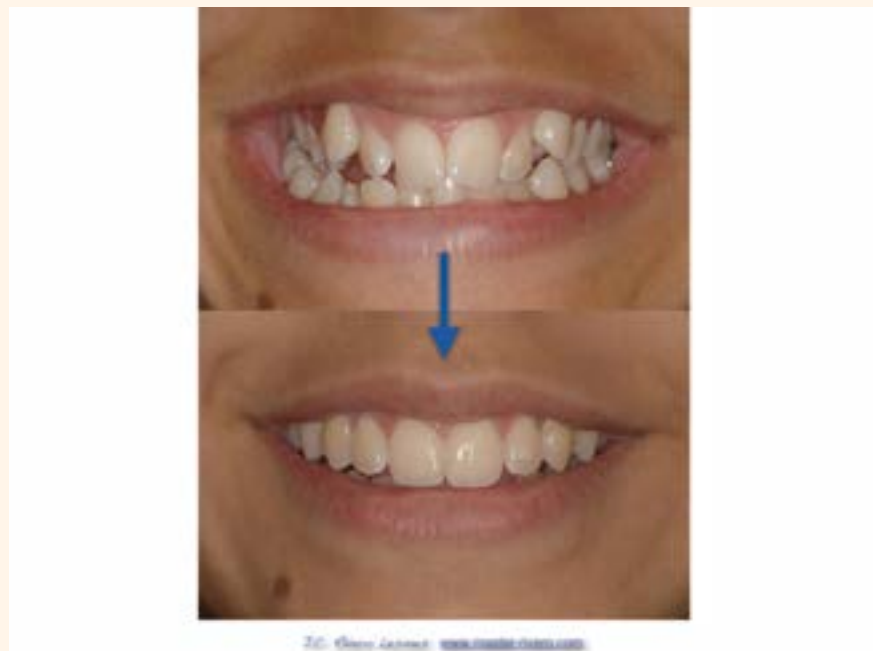
Figura 6. Caso 2.