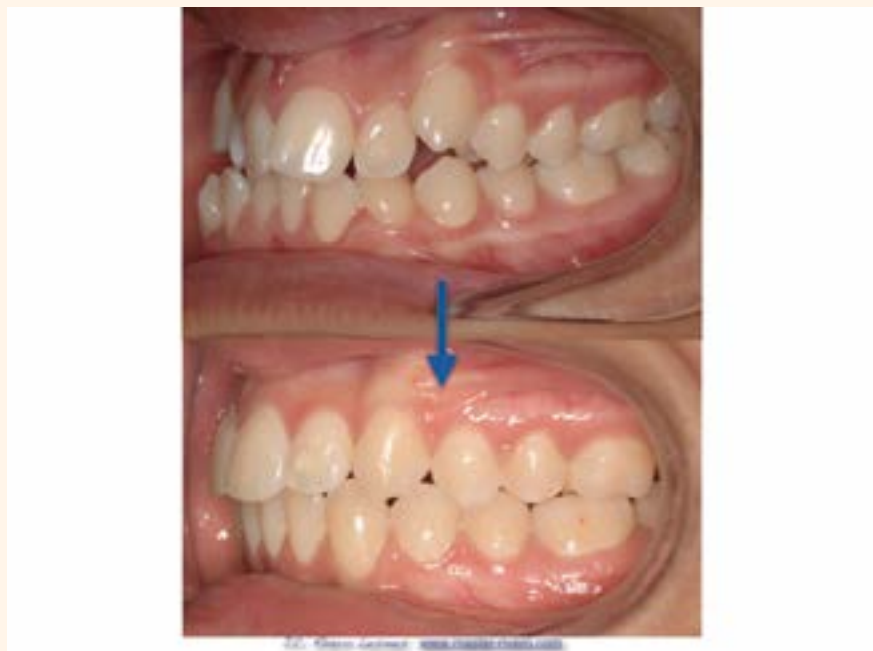
Figura 5. Caso 2.