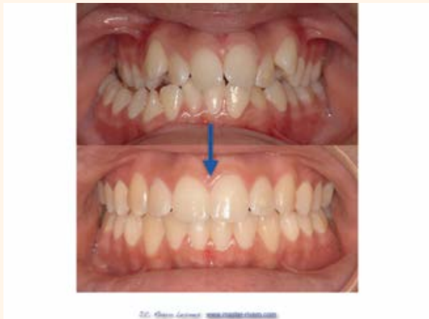
Figura 3. Caso 2.