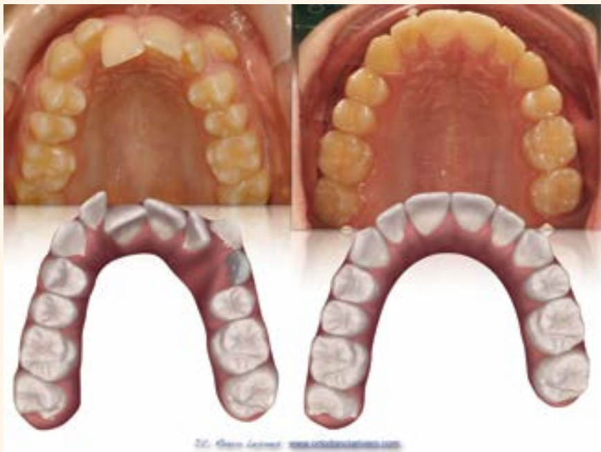
Figura 5. Caso 1.