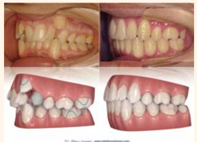
Figura 4. Caso 1.