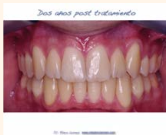
Figura 8. Caso 1.