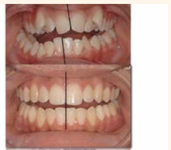
Figura 2. Caso 2.