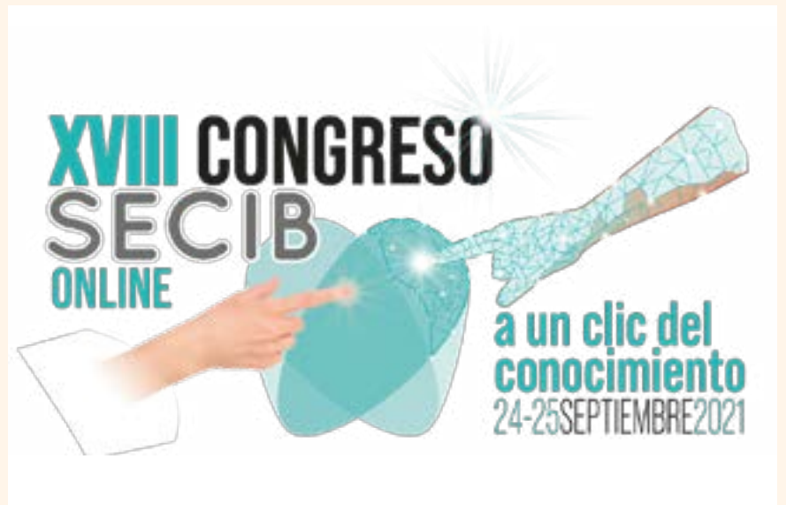
Imagen del XVIII Congreso SECIB online.

vegación guiada a la cirugía bucal, más allá de la implantología. Se trata, según se remarca desde el Comité Científico de SECIB Online 2021,