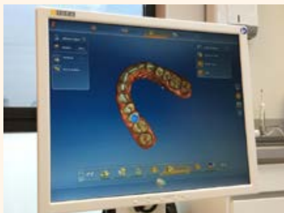
Figura 9. Escaner intraoral CEREC.