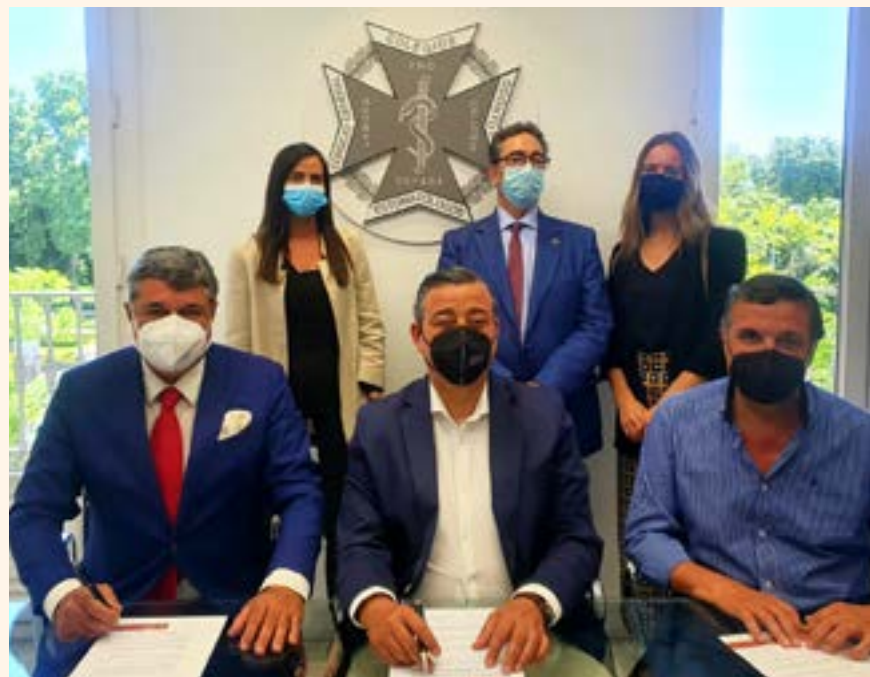
Fotografía tomada durante el acto de adscripción.