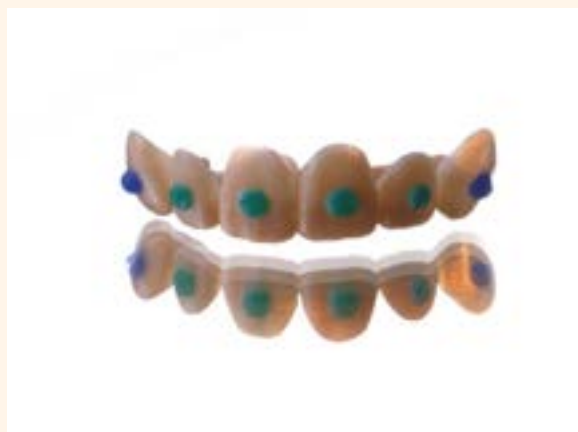
Figura 21. Mock-up maya impreso en 3D después de la caracterización.