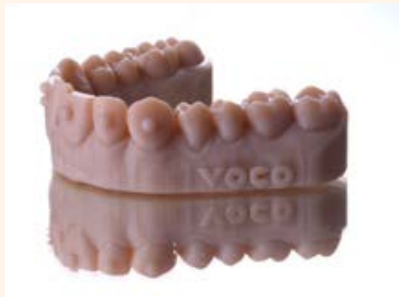
Figura 17. Wax-up maya impreso en 3D.