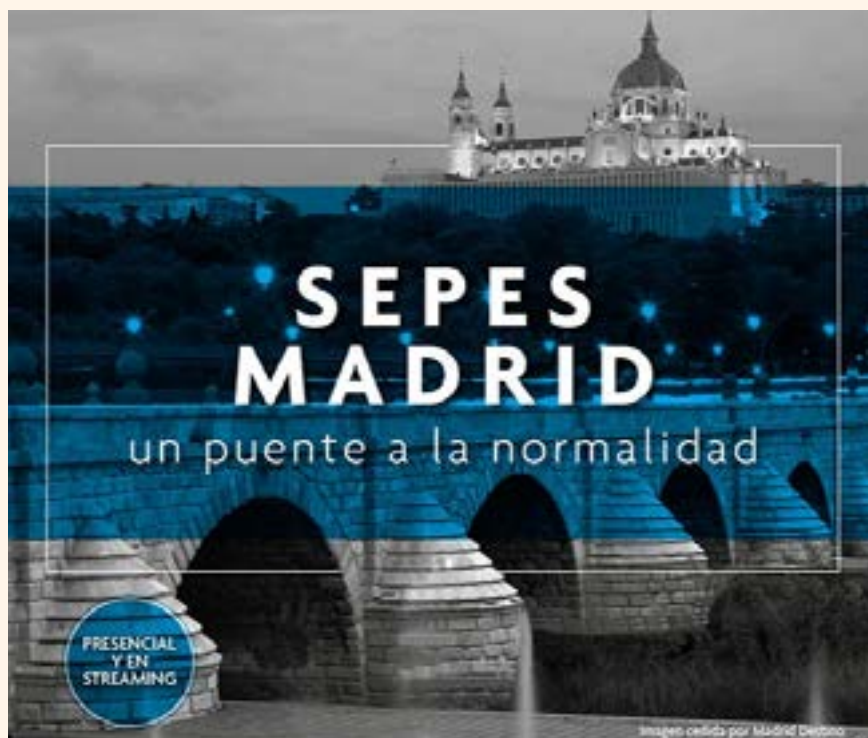
Imagen del Congreso SEPES Madrid

Además, se celebrarán sesiones específicas integradas en el programa Odontología y Bienestar que, en colaboración con el COEM y con el Madrid Convention Bureau a través de su programa “Legado”, tendrán