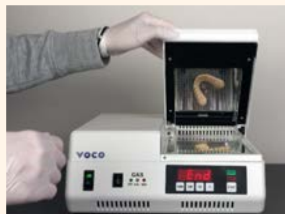
Figura 13. Unidad de fotopolimerización por luz ultravioleta.