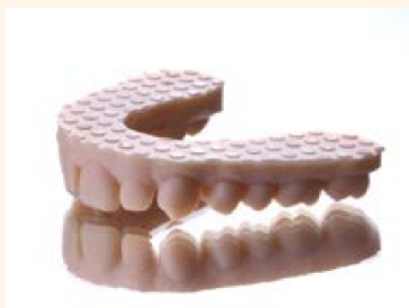
Figura 12. Dientes antes de la caracterización.