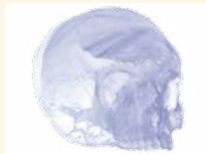
Figura 7. Cráneo maya impreso en 3D.

la cabeza de sus hijos para controlar el crecimiento craneofacial (Fig. 2). Los mayas utilizaron la existencia de las fontanelas, áreas de tejido entre los huesos del cráneo, para dar forma a la cabeza de los niños. El resultado era un cráneo aplanado en la frente y el hueso occipital con una forma ovoide general. Esta deformación no se realizaba con fines terapéuticos, sino con fines plásticos. Era cultural y permitía identificar el grupo étnico y social del individuo.