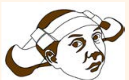
Figura 2. Niño maya con placas de crecimiento.