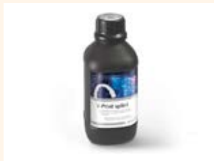
Figura 6. V-Print splint.