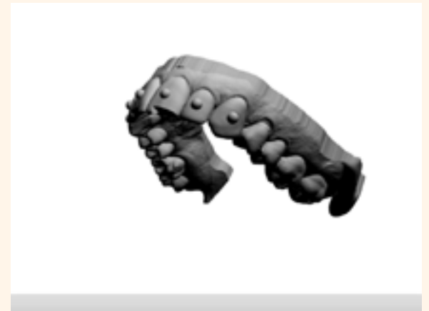
Figura 16. Wax-up maya virtual.