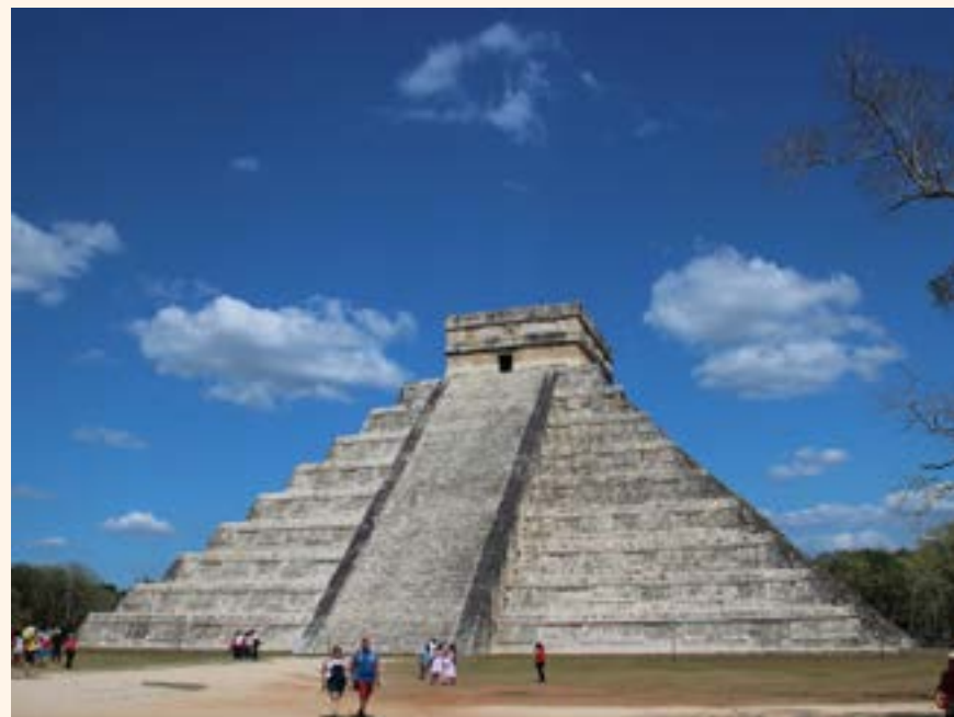
Figura 1. Templo de Kukulcán.

Sorprendentemente, los mayas ya practicaban la ortopedia craneofacial. Si miramos los esqueletos, podemos ver que esta gente tenía un perfil característico. El cráneo lo estiraban y elevaban, retrocedían la frente y el puente de la nariz lo continuaban con la frente hasta llegar a la parte superior del cráneo. Estos criterios craneofaciales eran el resultado de las prácticas ritualistas: las mujeres colocaban placas rígidas en