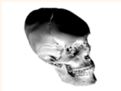
Figura 5. Cráneo Maya Virtual.