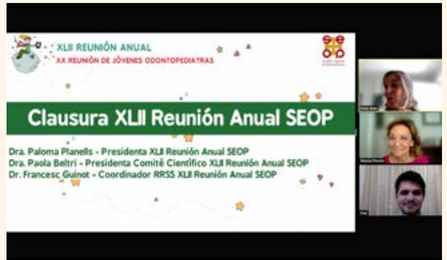
Imagen tomada durante el acto de clausura del congreso.

En palabras de la presidenta de la reunión, la Dra. Paloma Planells “en este congreso hemos puesto en valor la Odontopediatría, actualizando la patología oral desde el embarazo a la adolescencia, dando cabida a to-