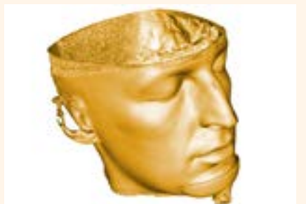
Figura 3. Reconstrucción facial.