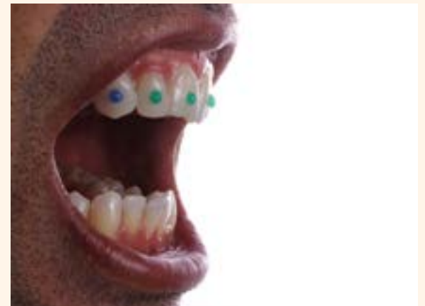
Figura 19. Prueba de mock-up maya.