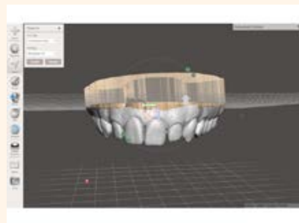
Figura 10. Plano de sección virtual de la base del modelo de diente.