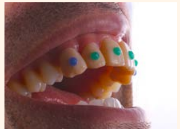
Figura 22. Prueba de mock-up maya impreso en 3D.

A5 para los premolares, A2 para los caninos y finalmente A1 para los incisivos. Se utilizó una resina de caracterización (FinalTouch, VOCO) para obtener una reproducción realista. Se colocó resina marrón en las grietas, naranja en las troneras. Se hicieron incrustaciones en resina verde y azul (Twinky Star, VOCO) en las caras bucales de los dientes para simular piedras preciosas. Finalmente, se simuló la encía con resina rosa (AMARIS Gingiva, VOCO). El resultado final es una arcada dental maya realista 50% digital y 50% manual (Fig. 14).