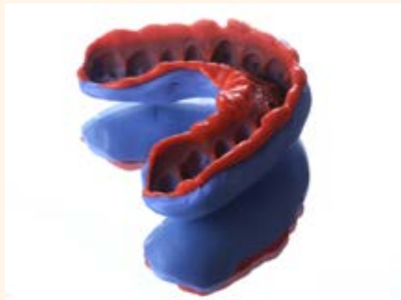
Figura 18. Llave de silicona.