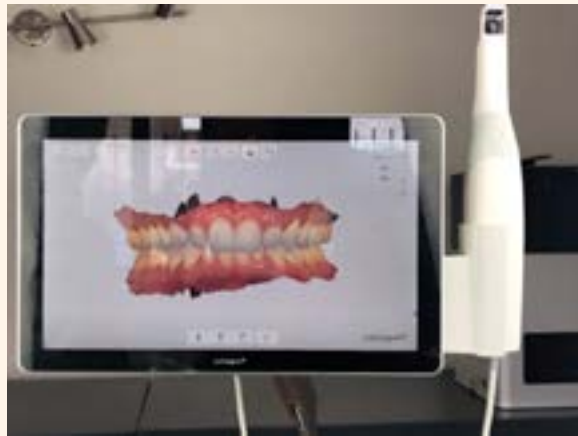
Figura 15. Escaner intraoral 3Shape.