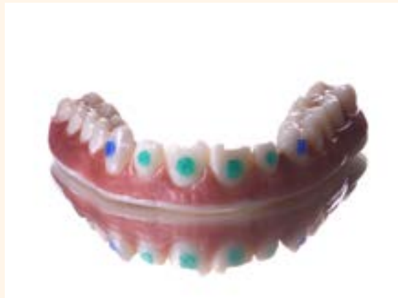
Figura 14. Dientes después de la caracterización.