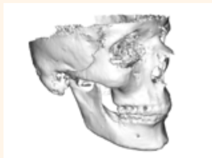
Figura 4. Reconstrucción del cráneo.