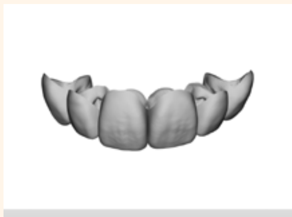
Figura 20. Mock-up virtual.