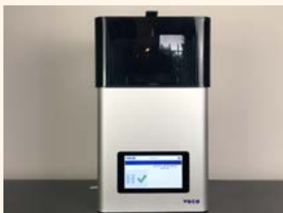
Figura 11. SolFlex 170.