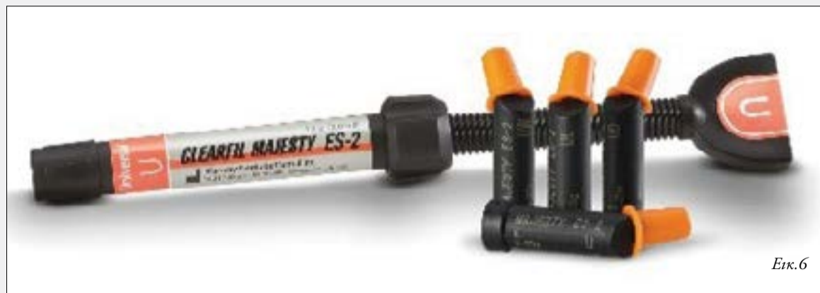
Εικ.6: CLEARFIL MAJESTY™ ES-2 Universal

Οι οδοντικές αποχρώσεις στην κλινική οδοντιατρική έχουν ταξινομηθεί εδώ και καιρό χρησιμοποιώντας τον οδηγό αποχρώσεων της VITA* Classical A1 – D4. Παρά το γεγονός ότι είναι πανταχού παρόντα στις οδοντιατρικές πράξεις,