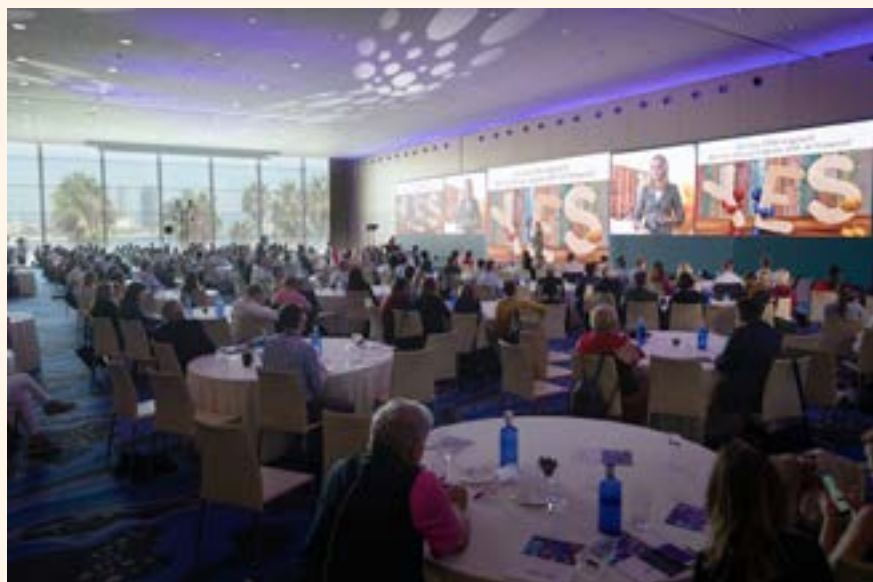
Fotografía de la sala en la que se realizaron las sesiones.

Para más información sobre Henry Schein Orthodontics póngase en contacto con nosotros en el +1 760.448.8600, por correo electrónico en usasales@henryscheinortho.com o a través de nuestro sitio web en www.HenryScheinOrtho.com . DT