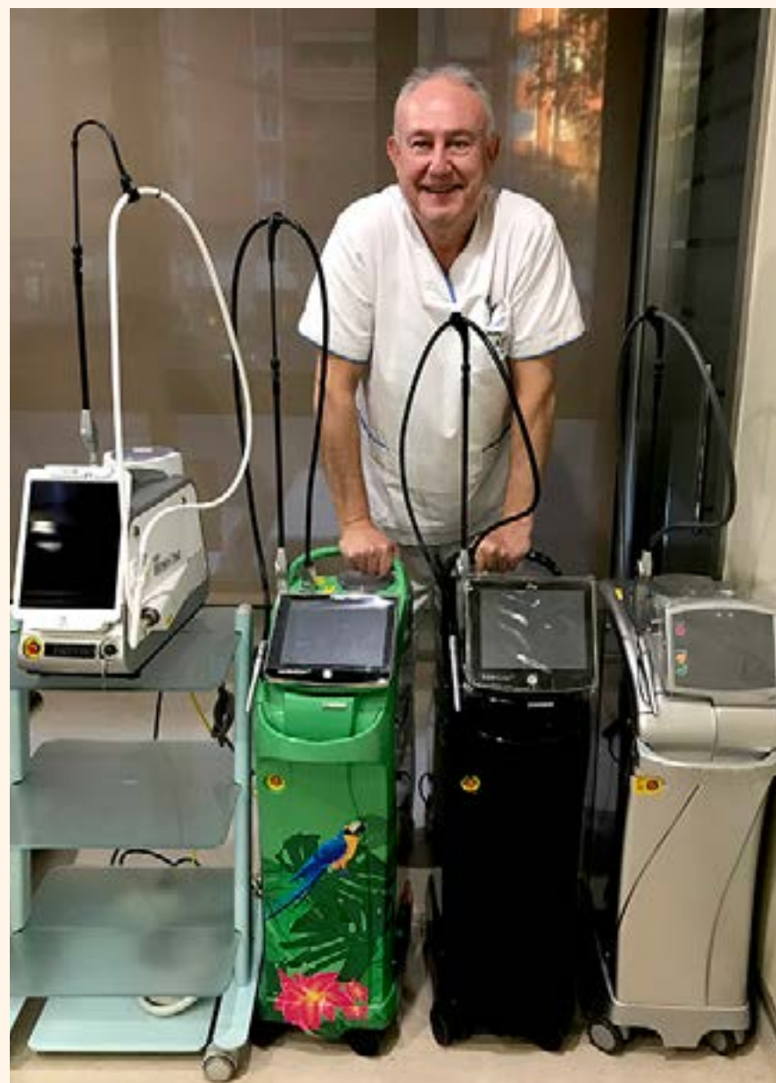
El experto posa orgulloso en su clínica de Barcelona con cuatro de sus láseres de Er,Cr:YSGG, dispositivos capaces de sanar tejidos enfermos, evitar la anestesia o acelerar movimientos ortodóncicos.