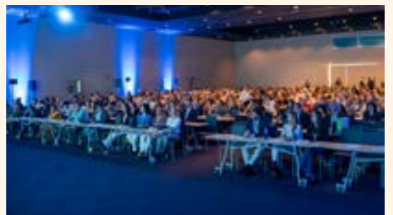
Serie de fotografías tomadas durante los días de celebración del XVII Congreso Nacional SECIB, que se celebró en Sevilla el pasado mes de octubre.