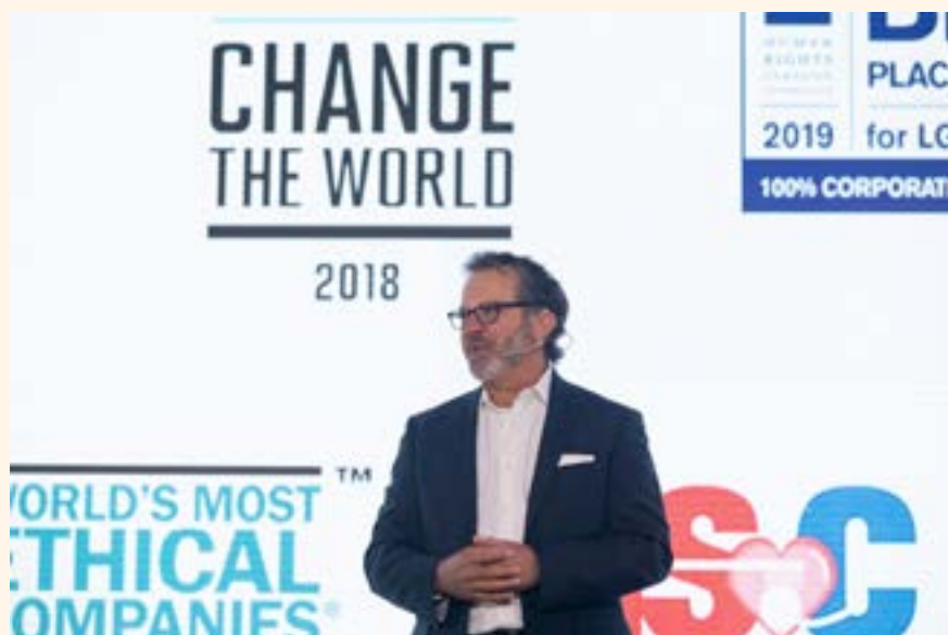
Imagen tomada durante una de las conferencias realizadas.