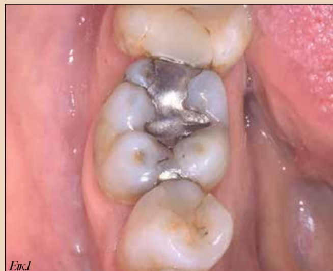
Εικ1. Αρχική κατάσταση.

Ασθενής 46χρονος προσήλθε με δευτερογενή τερηδόνα στους 35, 36 και 37. Τα δόντια αποκαταστάθηκαν με ένθετα CAD/CAM (Straumann nice A2 LT) που κατασκευάστηκαν στο ιατρείο και συγκολλήθηκαν με ρητινώδη κονία γενικής χρήσης 3M RelyX και συγκολλητικό παράγοντα γενικής χρήσης 3M Scotchbond Plus χρησιμοποιώντας την τεχνική της επιλεκτικής αδροποίησης.