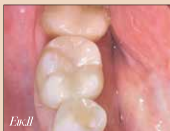
Εικ.11. Τελικό αποτέλεσμα.