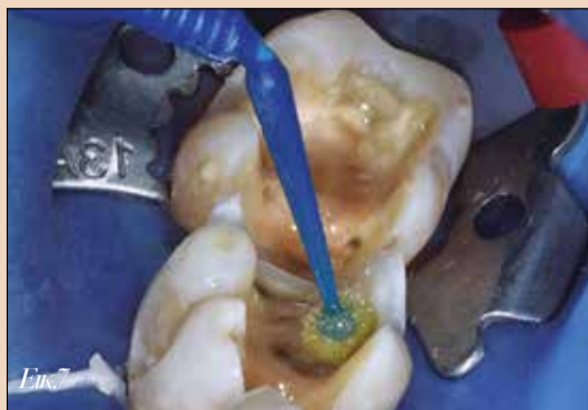
Εικ.7. Τοποθέτηση του συγκολλητικού παράγοντα γενικής χρήσης 3M Scotchbond Plus.