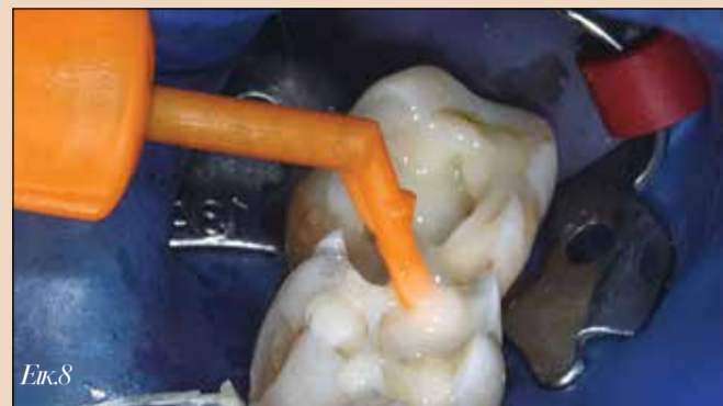
Εικ.8. Τοποθέτηση της ρητινώδους κονίας γενικής χρήσης 3M RelyX μέσα στις κοιλότητες.