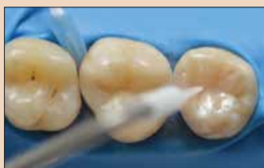
Εικ.6: Διαμόρφωση της μασητικής επιφάνειας της αδαμαντίνης με την CLEARFIL MAJESTY ES-2 Premium σε απόχρωση A2E.