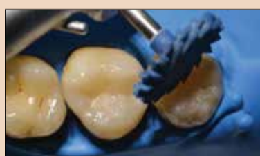
Εικ.7: Στέλβωση της αποκατάστασης με Twist DIA for Composite (σύνθετων ρητινών). ES-2 Premium σε απόχρωση A2E.