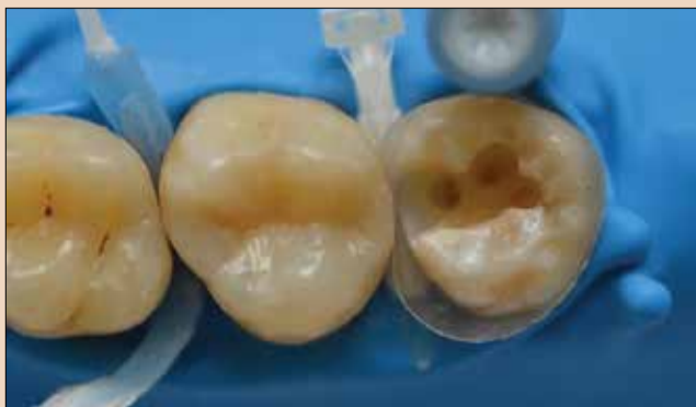
Εικ.2: Απομόνωση του χειρουργικού πεδίου.