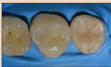
Εικ.8: Το αποτέλεσμα της θεραπείας.