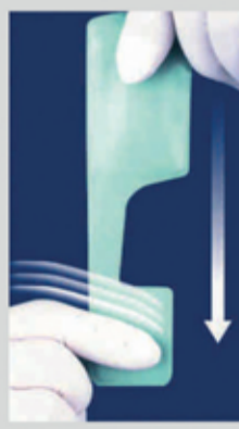
Εμφάνιση & Στερέωση μόνο σε 50 δευτερόλεπτα