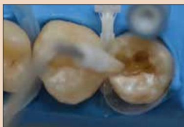
Εικ.4: Ανασύσταση του γγγύς τοιχώματος με CLEARFIL MAJESTY ES-2 Classic (Kuraray Noritake Dental Inc.) σε απόχρωση A2.