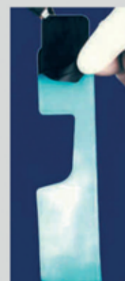
Ξεπληνείτε προσεκτικά για τέλεια ευκρίνεια & πιστότητα