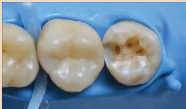
Εικ.1: Κοιλότητα Ομάδος II στον δεύτερο γομφίο μετά την αφαίρεση της τετηρόνας και την παρασκευή της κοιλότητας.