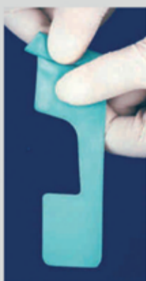
Πιέστε για να κατέβει το διάφραγμα