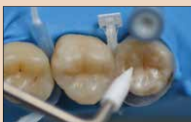
Εικ.5: Ανασύσταση της οδοντίνης χρησιμοποιώντας τη διαστρωματική τεχνική με την CLEARFIL MAJESTY ES-2 Premium στην απόχρωση A2D.