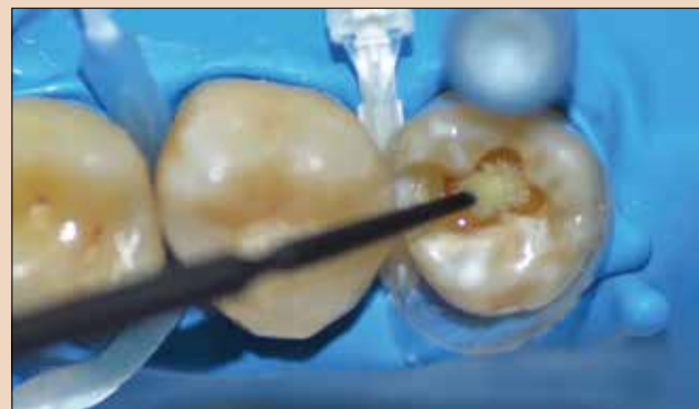
Εικ.3: Εφαρμογή του συγκολλητικού παράγοντα (π.χ. CLEARFIL S3 BOND PLUS) στην κοιλότητα.