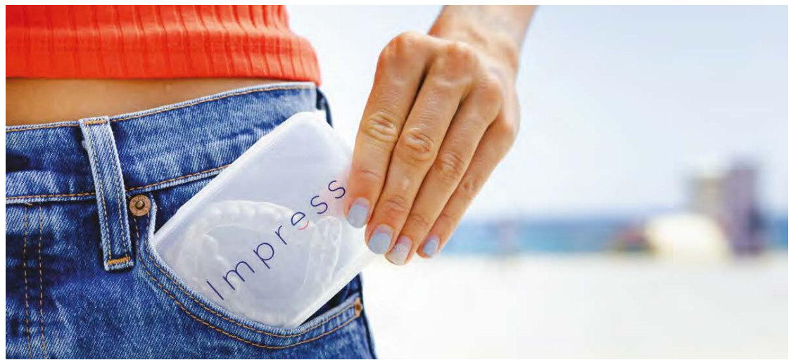
Impress je objavio da će njihova najnovija vodeća klinika biti smještena u Leedsu u UK-u te da će nuditi početne konsultacije pacijentima uživo.

Impress pacijenti dobiju početne konsultacije na jednoj od naših klinika. To uključuje puni oralni pregled, radiografski snimak i 3D-skenove. Od tog trenutka, medicinski specijalisti u Impressu razvijaju personaliziranu virtualnu simulaciju cijelog procesa tretmana. Pacijent potom koristi mobilnu dentalnu aplikaciju kod kuće kako bi pratio svoj