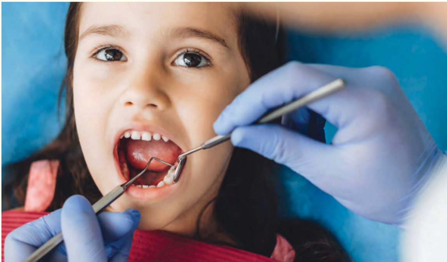
Nova studija je otkrila da djeca sa primarnim poremećajem imunodeficijencije skoro deset puta više sklona pojavi parodontalne bolesti u poređenju sa sistematski zdravom djecom iste starosne dobi.

LONDON, UK: Primarna imunodeficijencija (PID) je okarakterisana nedostatkom i lošom funkcionalnošću dijela tjelesnog imunog sistema. Bilo da je ovaj poremećaj dobiven rođenjem ili stečen poslije u životu, on onemogućava tjelesnu borbu protiv bilo kakve infekcije. Novo istraživanje je pokazalo da su djeca sa PID-om, s obzirom na to da nemaju prirodnu odbranu protiv oralne mikroflore koja izaziva parodontalnu bolest, podložnija pojavi gingivitisa u poređenju sa sistematski zdravom djecom.