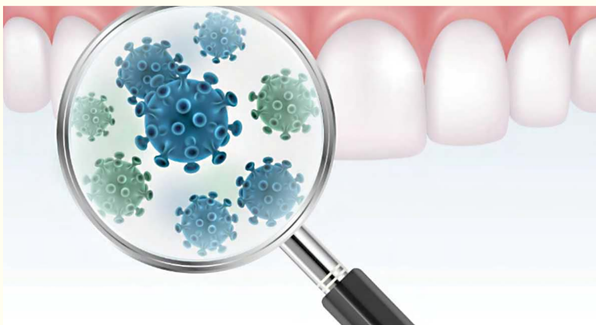
Napravljena je zvanična hipoteza koja kaže da korona virus može inficirati pluća kroz krvotok iz usta, a ne samo kroz disajne puteve.

Ovo otkriće bi moglo učiniti efikasno oralnu higijenu aktivnošću koja spašava život. Upravo zbog toga su istraživači predložili poduzimanje jednostavnih, ali efikasnih koraka ka održavanju oralne higijene te smanji-