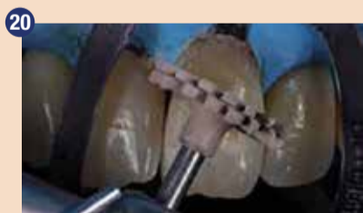
20 Pomembno je, da restavracije finiřiramo in spoliřamo – posebej tiste zraven dlesni – da dosežemo gladko površino, ključno za ohranjanje zdravih parodontalnih tkiv.