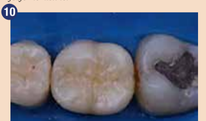
Zaključni sloj G-ænial A'CHORD odtenka JE postvari naravno morfologijo in doda pravilno barvo in svetlost, s čimer smo nadomestili okluzalno sklenino.