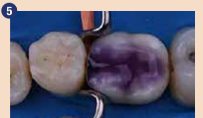
V tem primeru smo izbrali tehniko total-etch (totalno jedkanje). Pred nanosom 1-PRIMERJA na sklenino in dentin smo nanесли gel iz 35 % fosforne kisline.