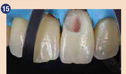
Pomembno je odstraniti sklenino brez opore, saj se s tem izognemo razpokam med polimerizacijo.