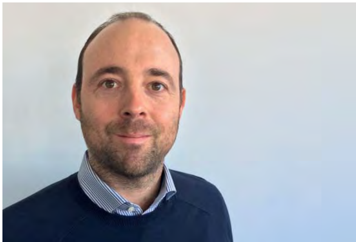
■ Nicolas Gehrig, Präsident des Arbeitgeberverbandes der Schweizer Dentalbranche (ASD) und der Swiss Dental Events (SDE).

Was im Internet fehlt, brauche ich Ihnen deshalb kaum zu erklären. Sie sind ja hier. Und wenn es nach den Ticket-Downloads geht: Sie und ich sind alles andere als alleine hier. Wir werden uns nicht gerade auf die Füsse treten, aber ausweichen – das werden wir uns kaum können.