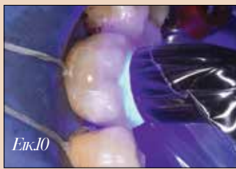
Εικ.10. Τελικός φωτισοπημερισμός με λυχνία φωτισοπημερισμού 3M Elipar DeepCure-S μετά τον καθαρισμό των περισσειών.