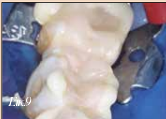
Εικ.9. Αιρέως μετά την τοποθέτηση - η περίσσεια της κονίας παραμένει στην θέση της για εύκολο καθαρισμό.