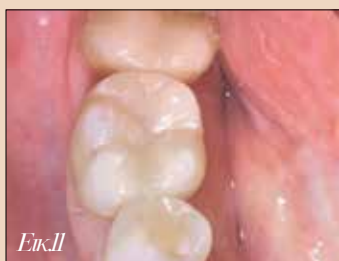
Εικ.11. Τελικό αποτέλεσμα.