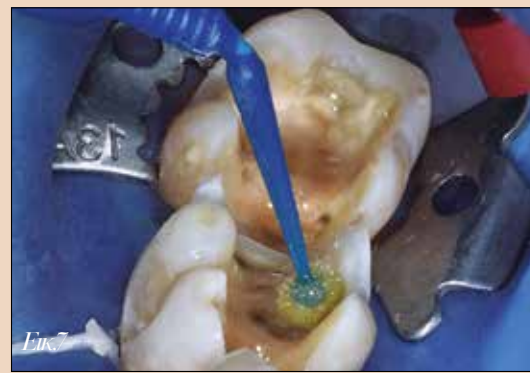
Εικ.7. Τοποθέτηση του συγκολλητικού παράγοντα γενικής χρήσης 3M Scotchbond Plus.