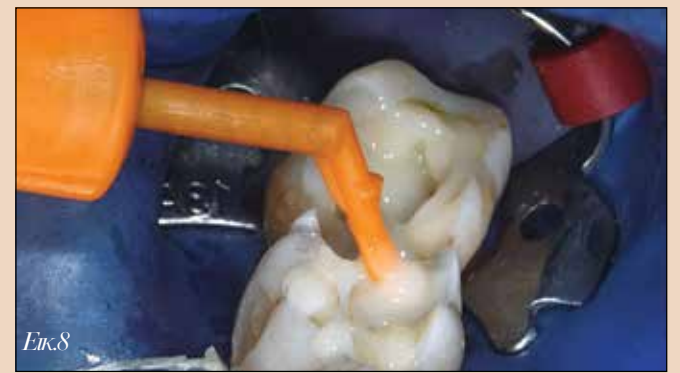
Εικ.8. Τοποθέτηση της ρητινώδους κονίας γενικής χρήσης 3M RelyX μέσα στις κοιλότητες.