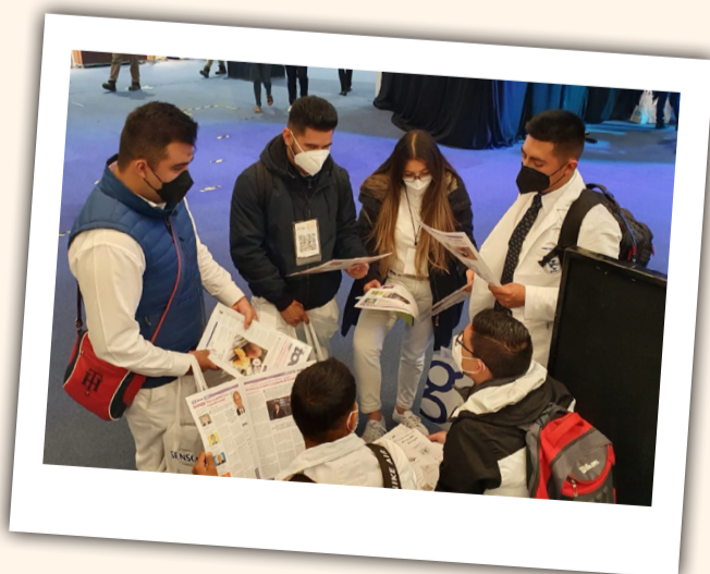
La nueva edición de "today" fue todo un éxito entre los más jóvenes.