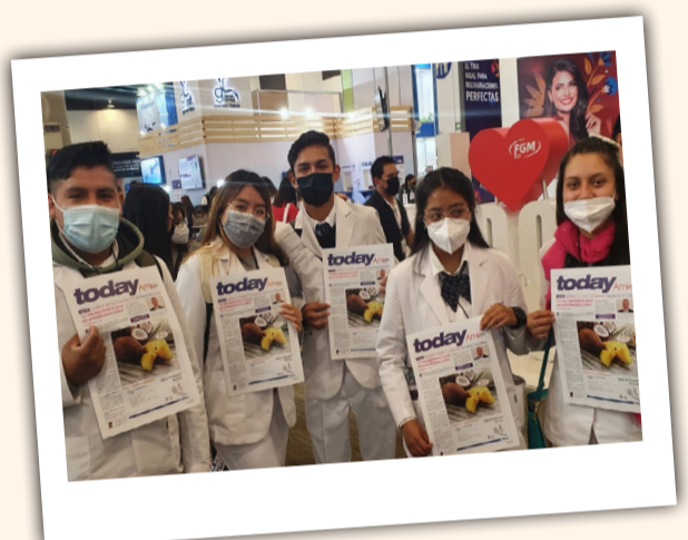
Un grupo de estudiantes de odontología con el periódico de ferias de Dental Tribune.