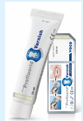
VOCO Profluorid Varnish en formato SingleDose.

Para más información visite www.voco.dental