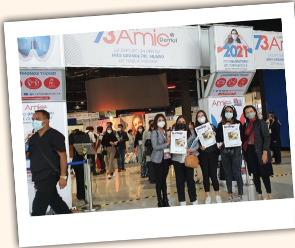
La entrada de la 73 edición de Expo AMIC Dental, la exposición dental más grande del mundo de habla hispana.