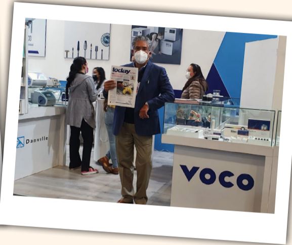
Un representante de Onipo, compañía que distribuye en México los productos de VOCO Dental, muestra el ejemplar del periódico "today" donde se publicó un anuncio de su nuevo barniz con sabor a piña colada.