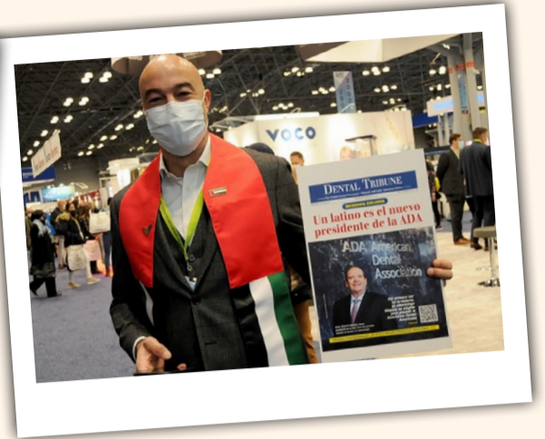
Torsten Oemus, presidente de Dental Tribune Internacional, con un ejemplar de la edición latinoamericana en el que aparece en portada el nuevo presidente latino de la Asociación Dental Americana.