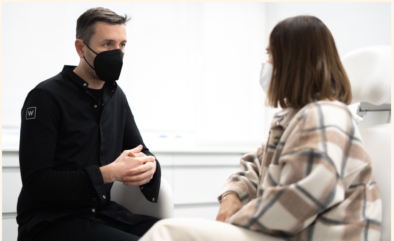
El método slow del Dr. Primitivo Roig consiste en trabajar con eficiencia, priorizando la calidad y recordando que el factor humano y la excelencia clínica son el mejor camino para alcanzar el éxito.

Para mí, el principal reto al que se enfrenta la odontología como colectivo en un futuro inmediato es mejorar nuestro posicionamiento competitivo frente a otros mercados de consumo, como la hostelería, el turismo o el ocio. En el pasado hemos quizá descuidado mirar más allá de nuestro sector. Nuestros pacientes viven en una sociedad transversal, con una oferta de consumo desorbitada de todo tipo de sectores y con unos recursos limitados para satisfacer sus necesidades y deseos. Deberíamos conseguir hacer entender a la población que invertir en su salud bucodental y en la mejora estética de su sonrisa es la mejor decisión del mundo.