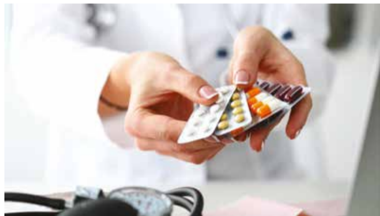
Ostatnie badania wykazały, że profilaktyczne stosowanie antybiotyków nie ma wpływu na częstość powikłań pooperacyjnych w zabiegach implantologicznych u zdrowych pacjentów.

Zagadnienie pozytywnego wpływu antybiotyków na utrzymanie implantów dentystycznych w ogólnej populacji zdrowych pacjentów jest nadal szeroko dyskutowane. W niedawnym badaniu naukowcy z New York University College of Dentistry starali się określić skuteczność profilaktyki antybiotykowej i schematów antybiotykowych w zapobieganiu zakażeniom pooperacyjnym (POI) po zabiegach wszczepienia implantów.