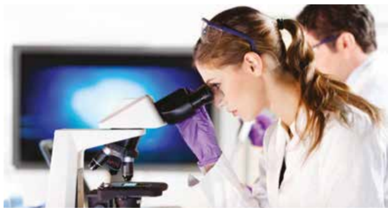
Wyniki nowego badania mogą pomóc w zmniejszeniu wysokiej śmiertelności z powodu raka jamy ustnej w krajach rozwijających się.