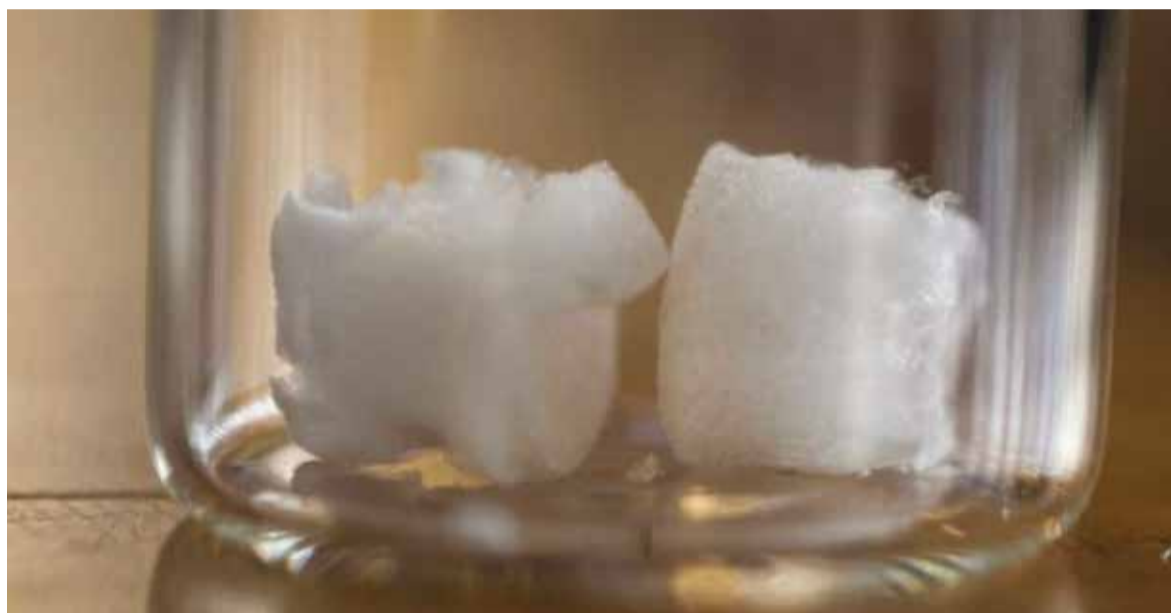
Naukowcy opracowali nowy materiał do regeneracji kości, pochodzący z celulozy roślinnej, który może być stosowany w przyszłości w implantologii stomatologicznej.

Badanie zatytułowane „Cross-linked cellulose nanocrystal aerogels as viable bone tissue scaffolds” zostało opublikowane 15 marca 2019 r. w tomie 87 Acta Biomaterialia.