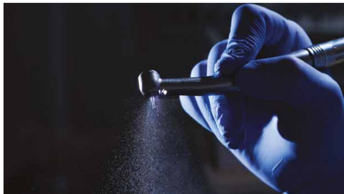
Brak ośrodków leczenia stomatologicznego, w których leczy się dzieci o specjalnych potrzebach zdrowotnych (Fot.: a17/Shutterstock).

„Myślę, że nauczanie tego powinno być dla szkół dentystycznych priorytetem” – skomentował Ziegler. „Sytuacja zmienia się na lepsze, ale nadal starania te są niewystarczające” – dodał. D