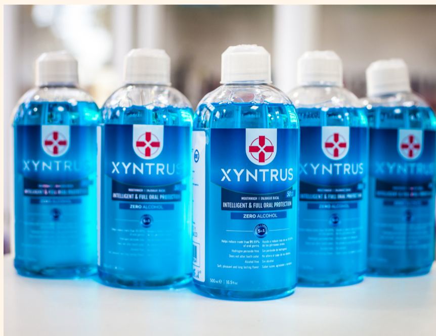
Un protocolo preoperatorio en la consulta con el colutorio Xyntrus, que contiene D-limoneno y CPC, puede reducir la propagación del SARS-CoV-2 y la posibilidad de que el odontólogo se infecte con el virus.

Poco después, el rehabilitador contactó con la Universidad Simón Bolívar de Barranquilla, a la que se acercó porque era la entidad científica encargada de realizar pruebas PCR aleatorias a la comunidad en esa ciudad colombiana. A raíz de ese encuentro fortuito se desarrolló en esa universidad un novedoso ensayo bioquímico para determinar los efectos de los enjuagues bucales en SARS-CoV-2.