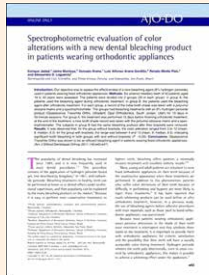
Artículo del autor sobre alteraciones en el color dental utilizando un producto aclarador en pacientes bajo tratamiento ortodóncico, publicado en la revista American Journal of Orthodontics en 2011.

Analizado lo sucedido y expresado por colegas, pensamos que el aporte de nuestras investigaciones es valioso y elimina paradigmas: ya no podemos