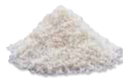
CORTICAL PARTICULATE MD 70/30 (70% Mineralized - 30% Demineralized)