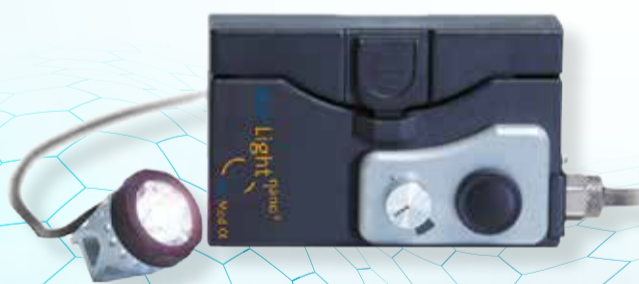
starLight nano 2