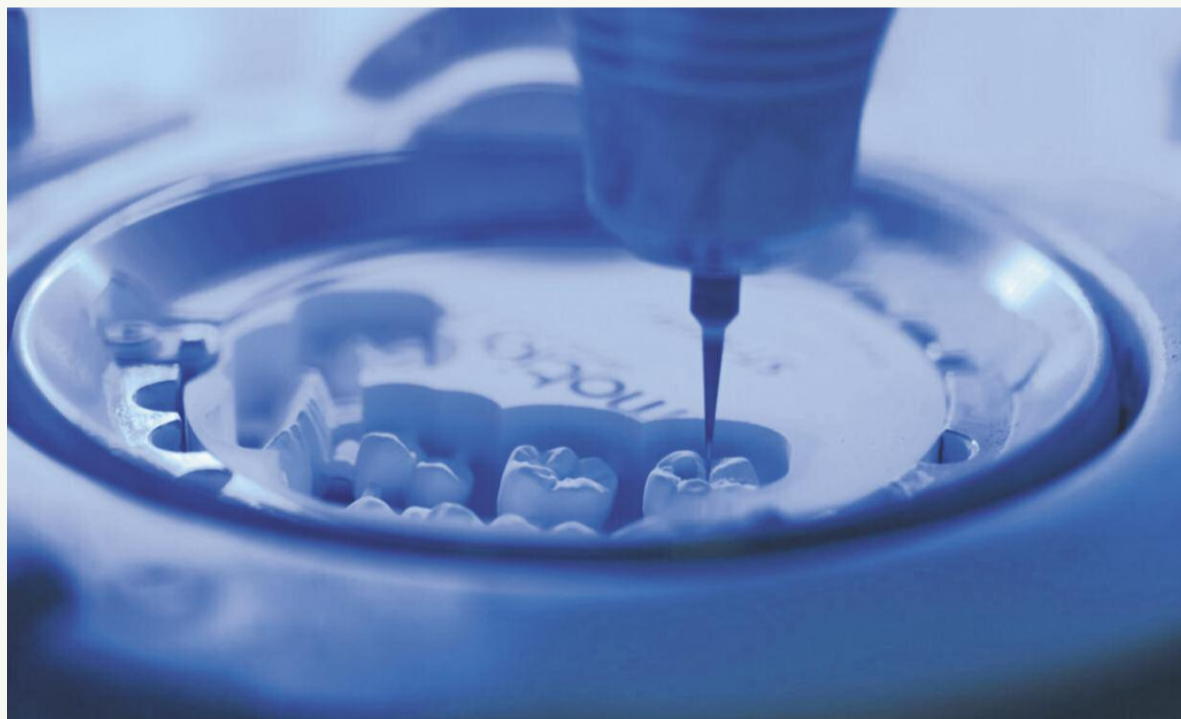
Эксперты отмечают огромный дефицит исследований, посвященных циркониевым реставрациям.

Авторы настоящего обзора поставили перед собой цель восполнить дефицит научных данных, выяснив, позволяют ли характеристики циркониевых коронок и НЗП, изготовленных обоими способами, сделать вывод о предпочтительности последних по сравнению с применявшимися ранее методами. В обзор были включены различные исследования in vitro , поскольку оказалось, что клинических исследований циркониевых коронок, изготовленных на 3D-принтере, просто не существует: выводы авторов должны помочь клиницистам