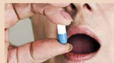
Εικ. 1 Οι ηλικιωμένοι είναι συχνόι χρήστες φαρμάκων, με περίπου 40% όσων ζουν στις οικίες τους και το 75% όσων ζουν σε ιδρύματα να λαμβάνουν πέντε ή περισσότερα φάρμακα.

στους ηλικιωμένους. Βρήκαν πως η χρήση φαρμάκων συσχετιζόταν σημαντικά με την ξηροστομία και την υπολειτουργία των σιελογόνων αδένων στους ηλικιωμένους.