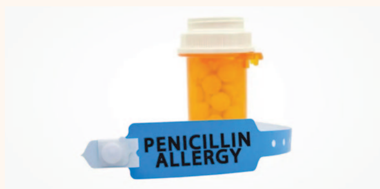
По словам доктора Bodil Lund, порядка 10% пациентов предупреждают стоматологов о наличии у них аллергии на пенициллин, тогда как реально аллергией страдают лишь около 1% населения.

В последние годы стоматологи всего мира инициировали просветительские кампании, направленные на распространение рационального и ответственного отношения к использованию антибиотиков. В Великобритании сразу несколько организаций, включая Британскую стоматологическую ассоциацию, Коллегию терапевтической стоматологии и Ассоциацию клинических микробиологов, объединили свои усилия, чтобы донести до стоматологов и их пациентов простую истину — «Анти-