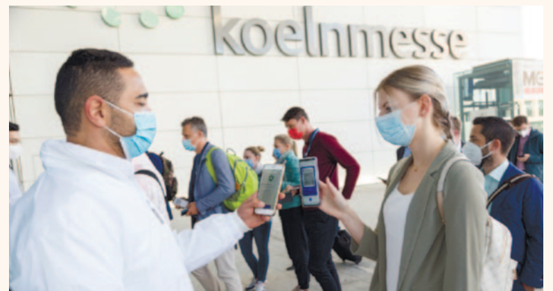
Организаторы IDS-2023 говорят, что выставка будет носить гибридный характер, и надеются, что она пройдет в «нормальных» условиях, т.е. с соблюдением тех же мер гигиенического и инфекционного контроля, которые были приняты на IDS 2021 г.

Выставка IDS 2023 г. будет развернута в семи залах общей площадью 180 000 кв. м. Таким образом, по своему масштабу она превзойдет предыдущие мероприятия; в 2019 г. 2260 экспонентов 38-й выставки, приехавших более чем из 60 стран, разместились на пло-