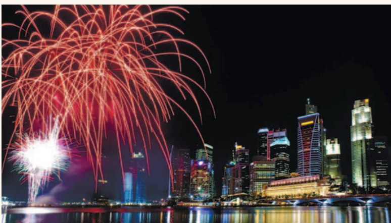
Только что из печати! На выставке IDEM медиахолдинг Dental Tribune International и его недавний сингапурский партнер Fireworks Business Information представили новое издание – DT ASEAN.