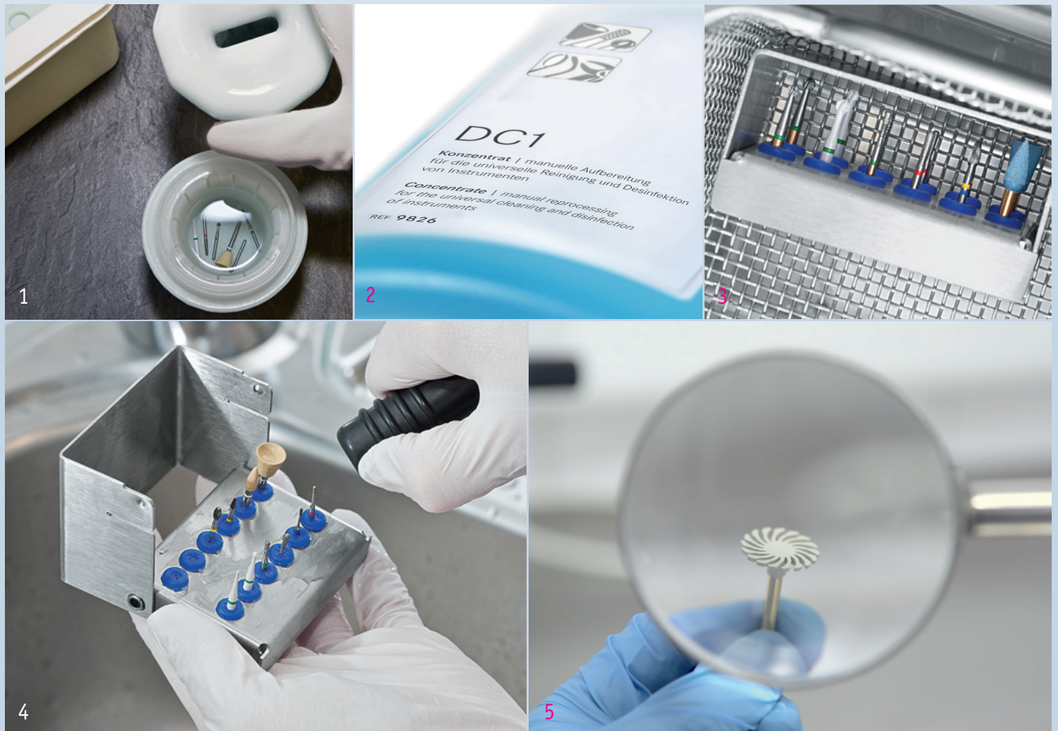
Abb. 1: Um eine optimale Aufbereitung zu gewährleisten, sollten die Polierer unmittelbar nach der Behandlung in eine alkoholfreie Reinigungs- und Desinfektionslösung gelegt werden. – Abb. 2: Die Schmutzpartikel werden durch die Vorreinigung mit DC1 effektiv gelöst. Zudem wird die Kontaminationskette unterbrochen und das Praxisteam bei der weiteren Aufbereitung optimal geschützt. – Abb. 3: Der Instrumentenständer wird in einer waagerechten Position in den Oberkorb des Thermodesinfektors gestellt, um Spülschatten zu vermeiden – Abb. 4: Nach Abschluss des Programms wird der Instrumentenständer aus dem Thermodesinfektor entnommen und mit Druckluft getrocknet. – Abb. 5: Bei der Sichtprüfung mithilfe einer Lupe werden verschlissene oder abgenutzte Polierer aussortiert.

Beim manuellen Verfahren müssen die Polierer nach der Vorreinigung im Ultraschallbad chemisch behandelt werden. Hierzu werden sie unverpackt im Dampfsterilisator in passenden Ständern oder Schalen thermisch desinfectiert.