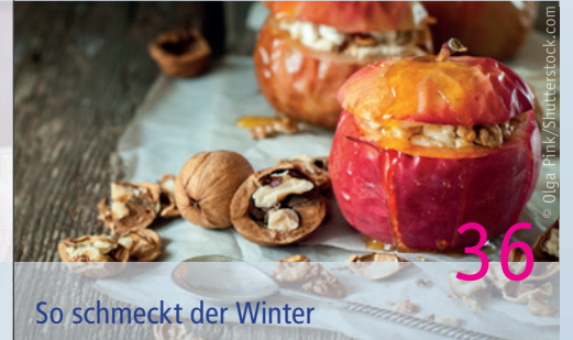
So schmeckt der Winter