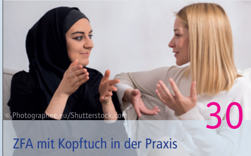
ZFA mit Kopftuch in der Praxis