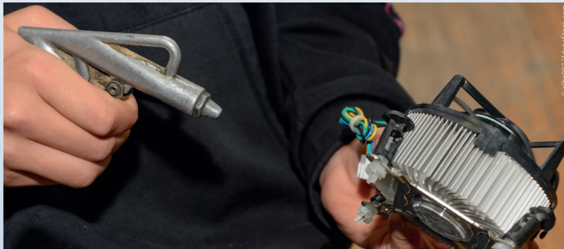
Eine Reinigung der einzelnen Komponenten mit Druckluft durch einen Fachmann entfernt auch schwer zugängliche Verunreinigungen.

Zur guten vorbeugenden Instandhaltung einer Praxis gehört auch die Wartung der sich im Einsatz befindlichen Computer. Wissenswert ist hier, dass sich das oben schon angesprochene Lüftersystem eines Computers im Laufe der Zeit zusetzt und daher nicht mehr für eine ausreichende Kühlung sorgen kann. Das kann zur Folge haben, dass die Innenteile überhitzen und der Com-