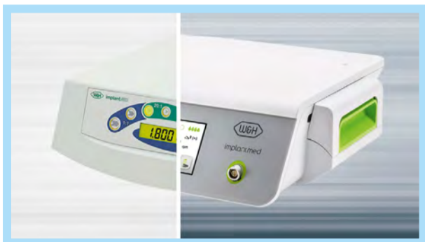
El concepto de manejo y procesos de programa uniformes de Implantmed garantiza su facilidad de uso.