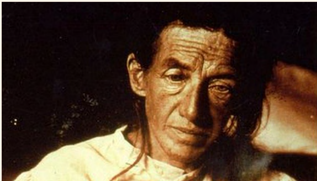
Auguste Deter, la primera persona en la que en 1906 se detectaron síntomas progresivos de Alzheimer que acabaron con su vida.