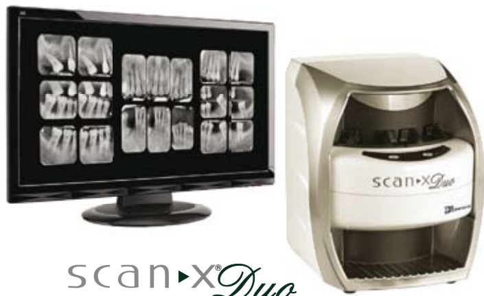
scan-X Duo Imagenología Digital Intraoral