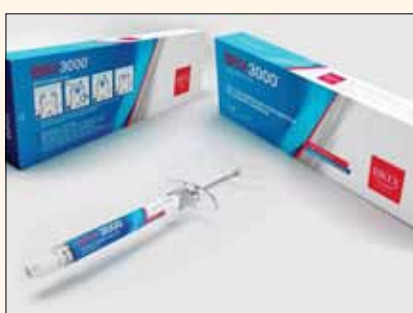
La compañía Brix Medical Science presentó un gel que remueve lesiones cariosas.

Este mecanismo logra, según la empresa, una mayor efectividad proteolítica para remover