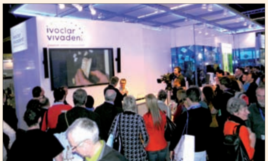
Una demostración en el stand de Ivoclar.