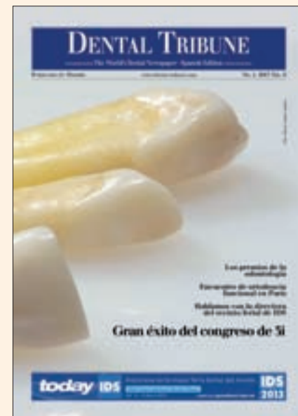
Portada del primer número de Dental Tribune Spain editado por Ripano.

Además, es la editorial de reconocidas organizaciones científicas internacionales como ALODYB (Asociación Latinoamericana de Operatoria Dental y Biomateriales), ALOP (Asociación Latinoamericana de Odontopediatría), SPO (Sociedad Peruana de Odontopediatría), AIO (Asociación Iberoamericana de Ortodontistas), IFUNA (International Functional