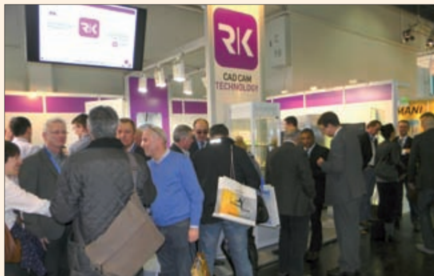
Los productos de la compañía alemana RK provocaron gran interés en Colonia.