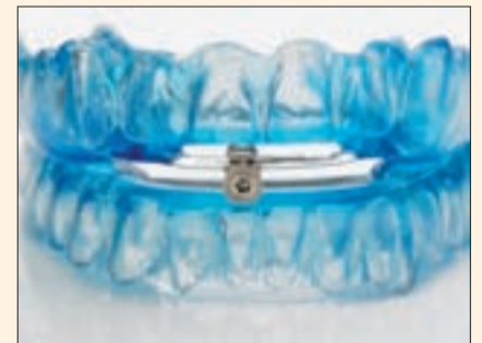
El dispositivo de avance mandibular que evita el ronquido y la apnea del sueño.

“Actualmente, es inevitable tratar el mundo dental desde una perspectiva