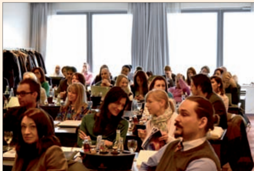
Un grupo de editores y directores de Dental Tribune International durante la 9ª Reunión de Editores de la compañía, que edita más de 100 publicaciones.

Ripano tiene filiales franquiciadas en todos los países de Latinoamérica, pero como parte del proyecto de consolidación con DTI este año abrirá delegaciones propias en Perú, Ecuador, Colombia, México y Venezuela.