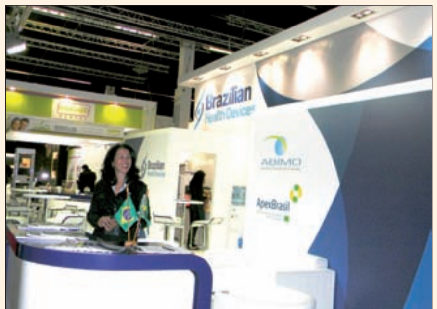
El área de recepción de ABIMO, la asociación de la industria médica y dental de Brasil.