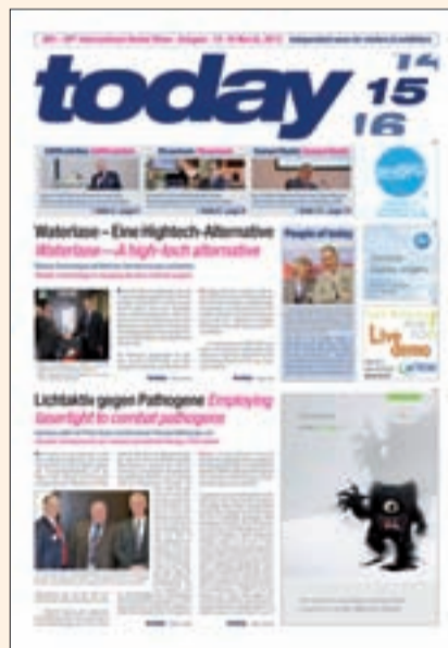
Portada de una de las ocho ediciones del periódico de ferias Today publicado en la IDS por DTI.

Uno de los grandes atractivos de la feria fue como siempre el "Media