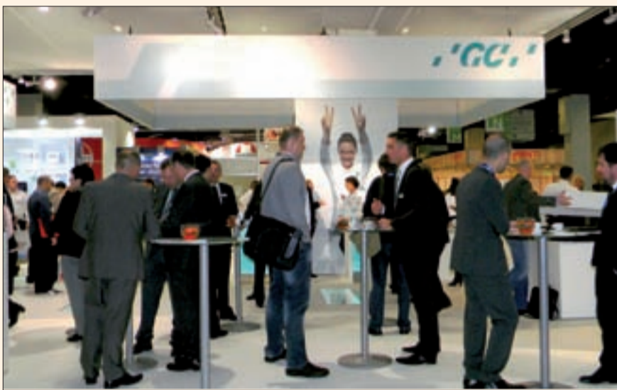
El stand de la compañía japonesa GC.