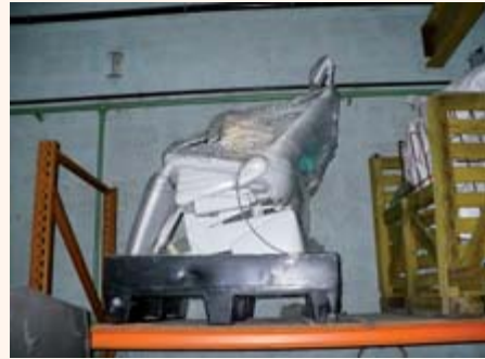
Fauteuil dentaire dans le réseau Recydent