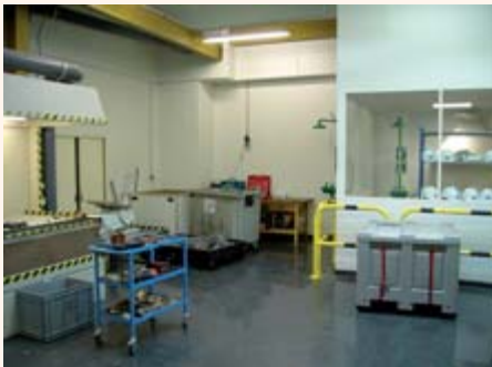
Site de déchets médicaux (Sage DRS)