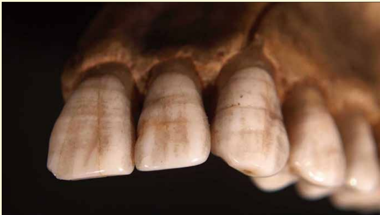
最新研究将儿童时期营养不良和健康状况不佳的牙釉质发育不全作为性别平等评价指标。