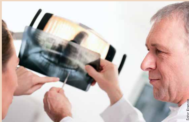
Die Altersgrenze für Vertragszahnärzte/-innen ist ein systemfremder Widerspruch, die Österreichische Zahnärztekammer will sie wieder kippen.

Ein Aberwitz der Handlungsabläufe ist es, dass in Deutschland fast im gleichen Zeitraum die Altersgrenze abgeschafft worden ist, in dem Österreichs