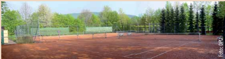
Die Studenten/-innen der DPU freuen sich sehr über die neuen Tennisplätze.