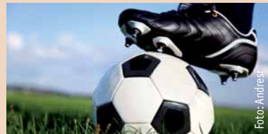
Seit dem vergangenen Jahr können die DPU-Studierenden Fußball und Tennis spielen.