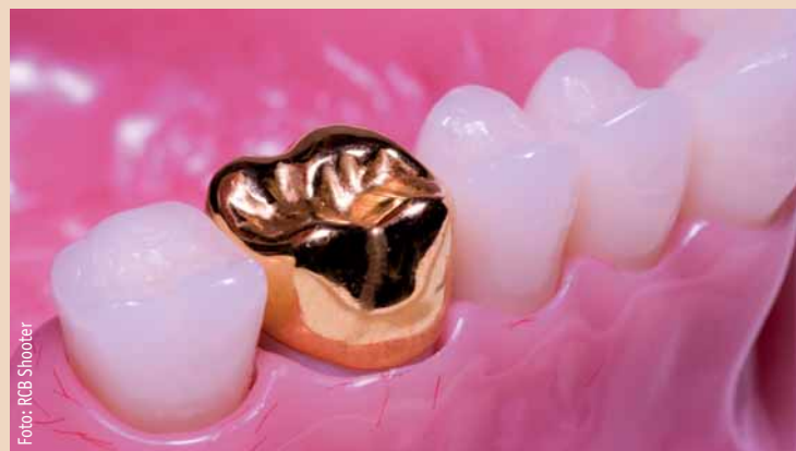
Das Material Gold ist immer weniger in der Zahnmedizin gefragt.

LONDON/LEIPZIG – Die Nachfrage nach Gold für die Herstellung von Dentallegierungen hat im letzten Quartal des Jahres 2010 ein neues Rekordtief erreicht. Laut aktueller Statistik des World Gold Council in London verzeichnete die Branche dort im Vergleich zum Jahr 2009 ein Umsatzminus von acht Prozent. Während die weltweite Nachfrage nach Gold stetig steigt, sinkt sie im dentalen Bereich. Über das ganze Jahr 2010 gesehen, sank der Absatz im Vorjahresvergleich um 5 Prozent auf 49,8 Tonnen. Der Gesamtumsatz betrug zwei Milliarden US-Dollar.