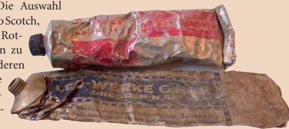
Die Tuben stammen aus dem Zweiten Weltkrieg und wurden ausgegraben.

Vor Kurzem hat mich ein englischer Journalist für einen Artikel interviewt. Durch diesen ist jemand vom Guinness World Records-Komitee auf mich aufmerksam geworden. Er schlug mir vor, mich zu bewerben. Das tat ich auch. Allerdings gibt es bisher keinen Rekord für Zahnpastatuben, deshalb mussten die Verantwortlichen überprüfen, ob eine neue Kategorie geschaffen wird. Die Entscheidung fiel positiv aus, nun muss ich jedoch beweisen, dass ich all diese Zahnpasten tatsächlich besitze. Ich muss Bilder vorweisen sowie eine detaillierte Liste aller Sammelstücke, Publikationen und Aussagen von Zeugen vorlegen. Für diese Prozedur hat mir bisher einfach die Zeit gefehlt. Anders als von einigen Medien berichtet, halte ich also keinen Guinness-Rekord. Ich hoffe aber, dass sich das in naher Zukunft ändert.