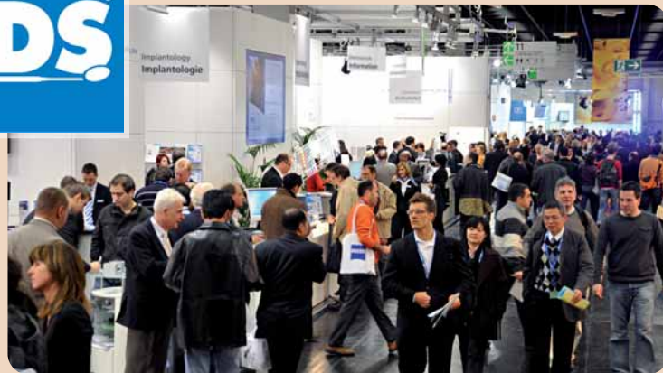
Rund 1.900 Unternehmen präsentieren sich heuer auf der IDS.

und langen Halt, sowohl für die Ober- und besonders auch für die Unterkieferprothese“, sagt Geschäftsführer