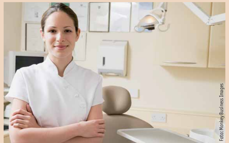
Wer ist die attraktivste und kompetenteste Zahnarztassistentin in Österreich?

Dental Tribune International Redaktion Dental Tribune Austria Kennwort: „Beste Zahnarztassistentin 2011“ Holbeinstraße 29 04229 Leipzig Deutschland