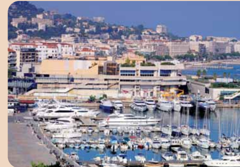
Das Internationale Osteology Symposium lädt nach Cannes ein.

heute State of the Art und mit klinischer Evidenz unterlegt sind, wie Risikofaktoren beurteilt und Komplikationen behandelt werden. Vorträge und Präsentationen zu neuen Studien und mit konkreten Behandlungstipps, aber auch das klinische Forum mit einer Podiumsdiskussion zu klinischen Fällen werden Antworten geben auf die Fragen: Was sind die