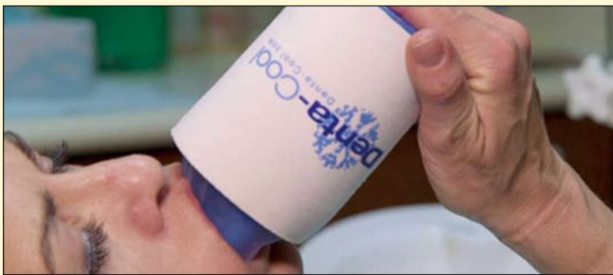
Denta Cool最近为牙科患者发布了一种非处方口内止痛剂, 可有效替代阿片类药物或冰袋。

药物, 而不是其他止痛药或医疗设备。然而, 根据各种研究, 尽管通常认为阿片类药物的使用是安全的, 但长期使用该类物质且剂量高于最初处方的患者可能会发展成阿片类药物成瘾、药物过量甚至死亡。美国国家药物滥用研究所报告说, 1999年至2017年, 在美国, 涉及类阿片的药物过量死亡人数增加了6倍, 从8048人增加到47600人。同期处方类阿片类药物死亡人数从3442人上升到17029人。