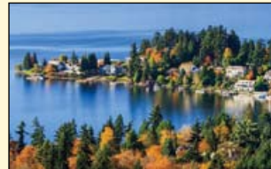
位于华盛顿湖畔的美丽小镇Kirkland。