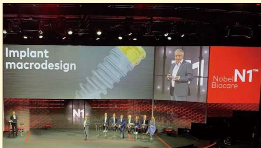
Nobel Biocare在西班牙举行的研讨会上展示了新的N1种植体系统。

这一新系统将很快向全世界牙科专业人员开放，旨在使治疗过程更快、更直接，治疗效果更加可预测。而实现这一目标需要挑