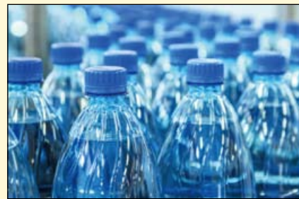
食品和药物管理局最近提出了一项规定，以降低制造商向瓶装水中添加氟化物的量，从而最大程度地提高健康效益并防止氟斑牙。

FDA将为公众、行业和其他利益相关者提供60天的时间来分享对拟议修订案的任何评论。该提案的标题是《修订加氟瓶装水中氟化物允许水平的拟议规则》。DT