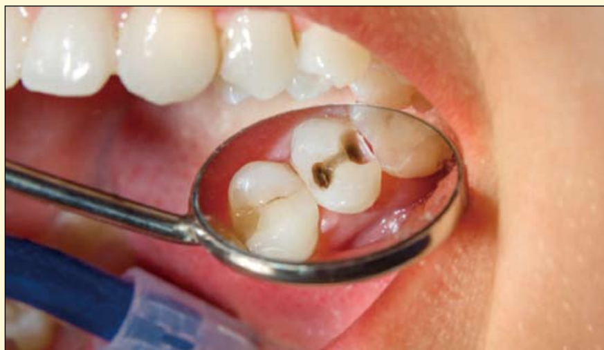
多伦多大学的研究人员发现，人类的免疫系统对龋齿的患病中起着一定的作用。