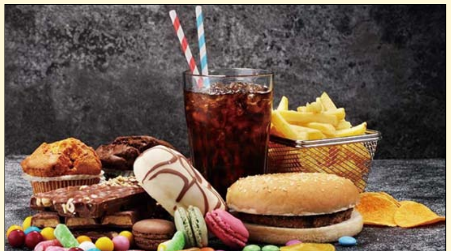
澳大利亚昆士兰州政府日前宣布，禁止在其拥有的广告位上促销不健康食品和饮料，这在澳大利亚尚属首例。

澳大利亚，布里斯班：不健康的饮食广告在这方面发挥了关键作用。为了遏制这一可能导致口腔和整体健康状况不佳，而广告现象，澳大利亚昆士兰州政府宣布了一项禁