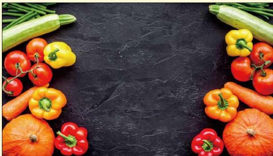
一项新的研究表明, 牙龈炎受饮食的影响很深。

研究表明, 虽然参与者的菌斑值没有差异, 但实验组牙龈出血显著减少。除了对口腔健康的潜在益处, 大幅的维生素D值增加和体重减轻也很明显。