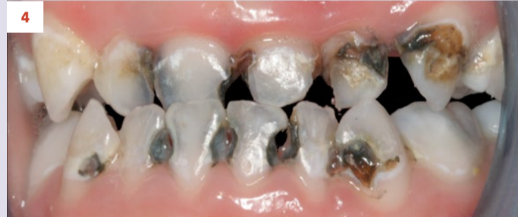
Afbeelding 3. Casus 2: 29-09-17. Eerste bezoek. Actieve cariës-instructies en ZDF aangebracht.