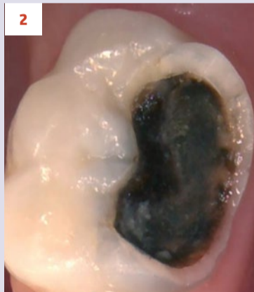
Afbeelding 2. Casus 1: 13-03-20. Na 4 maanden zwart verkleurd en symptoomvrij met vitale pulpa.