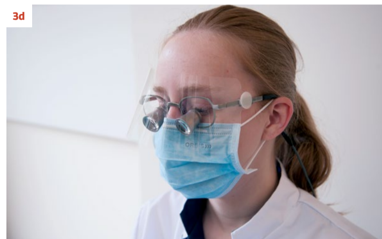
Afbeelding 3. (a) Beschermende bril; deze wordt gedragen in combinatie met een mond-neusmasker. (b) Gelaatsscherm; dit wordt gedragen in combinatie met een mond-neusmasker. (c) Gecombineerd spatscherm en mondneusmasker. (d) Beschermende loepbril; deze wordt gedragen in combinatie met een mond-neusmasker.