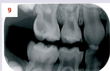
Afbeelding 9. Casus 3: 18-10-19. BWR, zie 55.