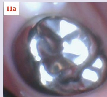
Afbeelding 11a-b. Casus 3: 23-01-20. In november met Hall-techniek geplaatste kroon met '50%-prognose' om enerzijds pijn en anderzijds narcose te voorkomen.