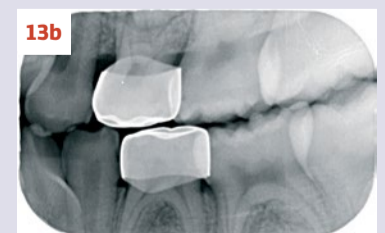
Afbeelding 13a-b. Casus 4: 04-03-19. BWR en BWL na 1 jaar in 2 tempi middels de Hall-techniek succesvol zonder spuit, boor of angst behandeld.