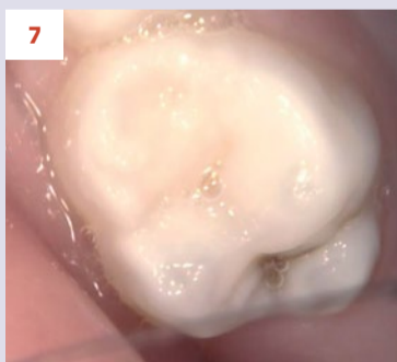
Afbeelding 7. Casus 3: 13-02-19. Intraorale foto 55 bij 3-jarig kind met zuigflescariës.