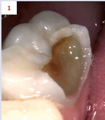
Afbeelding 1. Casus 1: 18-12-19. Kiespijn dreigt. ZDF aanbrengen veroorzaakte minutenlang pijn.