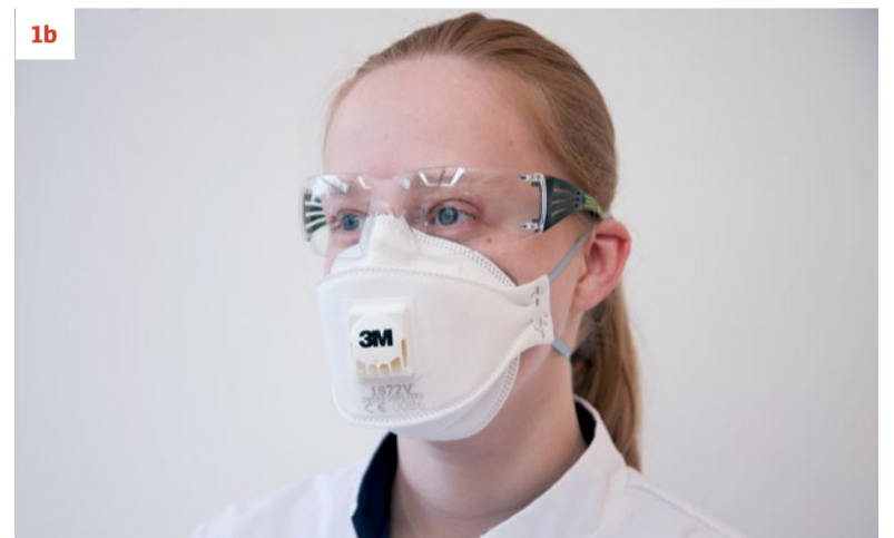
Afbeelding 1. (a) Chirurgisch mond-neusmasker van het type disposable halfgelaatsmasker. Het mond-neusmasker sluit goed aan op het gezicht. (b) FFP2 mond-neusmasker met ademhalingsventiel. Het mond-neusmasker sluit goed aan op het gezicht.

Het masker moet worden vervangen volgens voorschrift van de fabrikant. Het meest gebruikte mond-neusmasker in de mondzorgpraktijk beschermt 20 tot 30 minuten. Wanneer het masker verontreinigd of nat is, beschermt het onvoldoende en moet het eveneens worden vervangen. Omdat een mond-neusmasker zo vaak moet