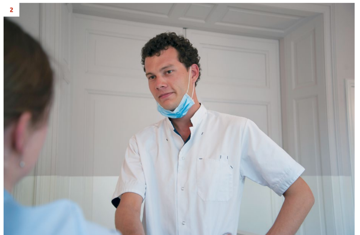
Afbeelding 2. Foutieve plaatsing van het mond-neusmasker onder de kin. De handen en het gezicht kunnen gecontamineerd worden bij het verplaatsen van het masker.

worden verwisseld, kunnen het best mondneusmaskers worden gebruikt die met elastiekjes achter de oren moeten worden bevestigd. Bij het verwijderen van het masker moet contact met de voorkant zo veel mogelijk worden vermeden. Omdat dit het meest gecontamineerde deel van het masker is, is de kans op besmetting van