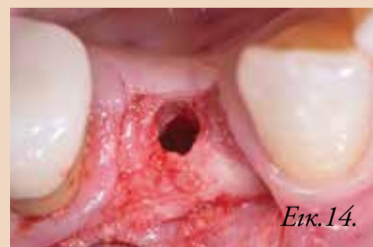
Εικ. 14. Ο μόνος τρόπος να αξιολογηθεί η ποιότητα του αναγεννημένου οστού είναι να συλλεχθεί μία οστική βιοψία με οστεοστρώπανο. Το οστικό δείγμα συλλέχθηκε από το κέντρο του αναγεννημένου οστού, οπότε εκεί δεν υπάρχει παλιό οστό, μόνο νεοσχηματισθείς αναγεννημένοι σκληροί ιστός.