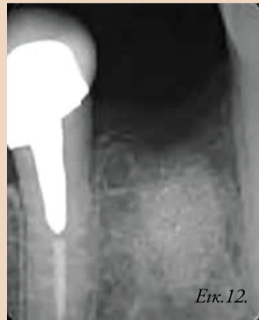
Εικ. 12. Οπισθοφαρνιακή ακτινογραφία τέσσερις μήνες μετεχειρητικά.