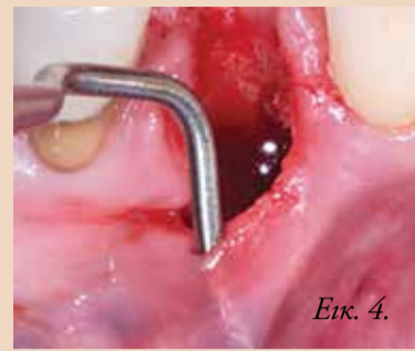
Εικ. 4. Η μετεξακτική περιοχή- παρατηρήστε την απώλεια του παρειακού πετάλου και τους λεπτούς παρειακούς μαλακούς ιστούς.