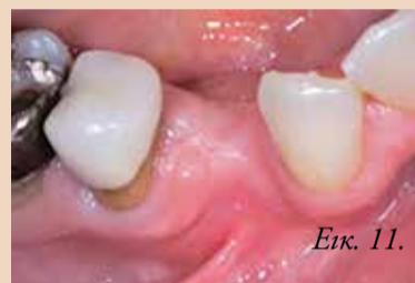
Εικ. 11. Κλινική εικόνα τέσσερις μήνες μετεχειρητικά.