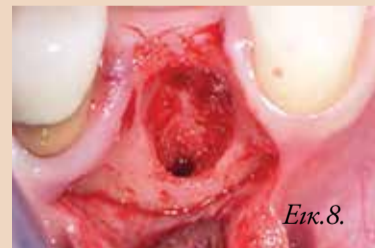
Εικ. 8. Ειδικός για την περιοχή κρημνός με διατήρηση των θηλών για να αποκαλυφθεί το φατνίο. Παρηγήστε την έλλειψη παρειακού οστού.