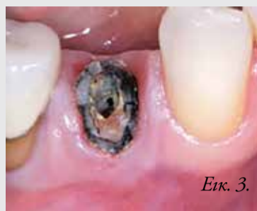
Εικ. 3. Κλινική εικόνα της τερηδονισμένης ρίζας μετά την αφαίρεση της στεφάνης.