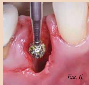
Εικ. 6. Απόξεση του φατνίου χρησιμοποιώντας εγγλυφίδες αποκοκκίωσης.