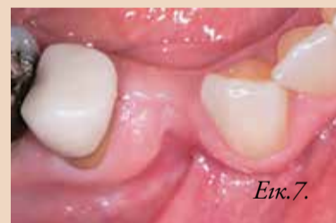
Εικ. 7. Κλινική εικόνα έξι εβδομάδες μετά την εξαγωγή. Ο δέκτης ήδη αναγέννησε μαλακούς ιστούς για να καλύψει το φατνίο.