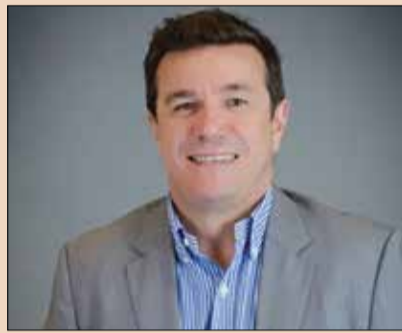
Επιστημονικός Υπεύθυνος: Καθηγητής Χρίστος Αγγελόπουλος

Μοναδικό, ολοκληρωμένο, πρωτοποριακό πρόγραμμα μετεκπαίδευσης οδοντιάτρων στις ψηφιακές τεχνολογίες από την Διαγνωστική & Ακτινολογία Στόματος του Οδοντιατρικού Τμήματος του ΕΚΠΑ (4 διαδακτικές ενότητες-modules) - Διάρκεια: 4 εβδομάδες (1 ΣΚ/ module) - Περιορισμένος αριθμός συμμετεχόντων (24)