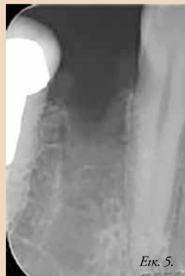
Εικ. 5. Οπισθοφραγματική ακτινογραφία αμέσως μετά την εξαγωγή.

Dentsply Sirona does not waive any right to its trademarks by not using the symbols or " 32670635-USX-1612 © 2016 Dentsply Sirona. All rights reserved.