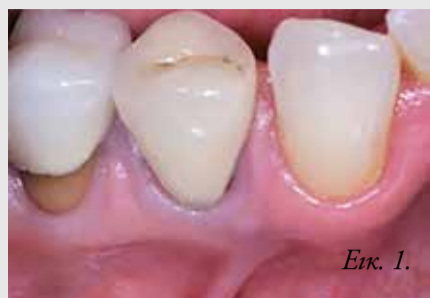
Εικ. 1. Αρχική κλινική εικόνα.

• Αποκάλυψη του εμφυτεύματος τρεις μήνες μετά από την τοποθέτηση και ακολούθως φόρτιση με την τελική κοχλιούμενη στεφάνη. Η εξαγωγή πραγματοποιήθηκε υπό τοπική αναισθησία χωρίς την αναπέταση κρημνού. Πρώτα, αφαιρέθηκε η στεφάνη με οδοντάγρα και η τερηδονισμένη ρίζα κινητοποιήθηκε και εξάχθη-