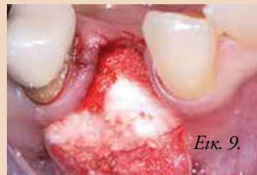
Εικ. 9. Στο φατνίο τοποθετήθηκε μόνος β-TCP/CS.

και τοποθετήθηκε μόνος στο φατνίο χρησιμοποιώντας ένα πλήρως απορροφούμενο συνθετικό υλικό οστικού μόνος αυτόματης σκλήρυνσης, που αποτελείται από β-TCP (65%) και CS (35%), όπως περιγράφηκε από τους συγγραφείς σε προηγούμενη δημοσίευση. Δεν χρησιμοποιήθηκαν μεμβράνες (Εικ. 9 και 10). Ο βλεννογονοπεριστικός κρημνός επανατοποθετήθηκε και συρράφηκε χωρίς τάση με ράμ-