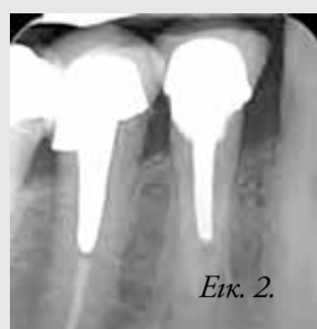
Εικ. 2. Αρχική ακτινογραφία.