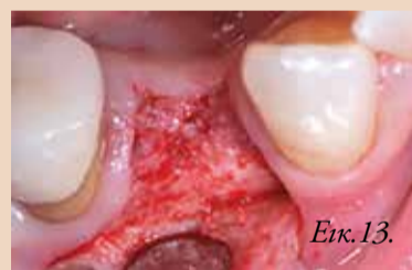
Εικ. 13. Επαρκής αναγέννηση των σκληρών ιστών κατά την εκ νέου είσοδο τέσσερις μήνες μετεχειρητικά.