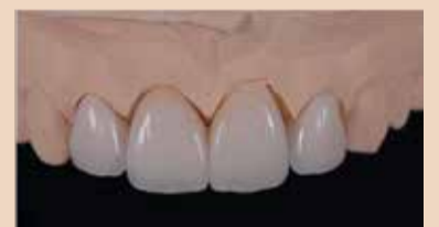
Εικ. 8 Οι ολοκληρωμένες αποκαταστάσεις στο εκμαγείο ελέγχου.

μεταξύ των 11 και 21, καθώς και μεταξύ των 21 και 22. Στην εγγύς επιφάνεια του 12, είχε πραγματοποιηθεί μία προσπάθεια να καλυφθεί αισθητικά το διάστημα με ρητίνη. Μία υπερώρια ναρθηκοποίηση των 11 και 21 με συγκρατητικό σύρμα ήταν ορατή μέσω του διαστήματος.