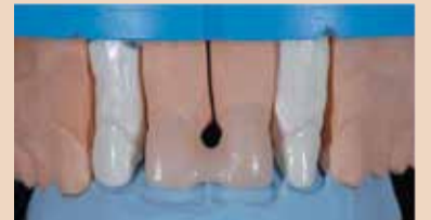
Εικ. 6 Εκμαγείο εργασίας με ανθεκτικά στην θερμότητα κολοβώματα και σκελετό διοξειδίου του ζιρκονίου.