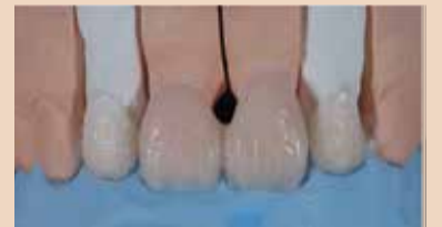
Εικ. 7 Φυσικής εμφάνισης διαστρωμάτωση του VITA VM 9 με κλειδί σιλικόνης.