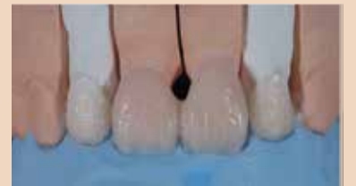
Εικ. 7 Φυσικής εμφάνισης διαστρωμάτωση του VITA VM 9 με κλειδί σιλικόνης.