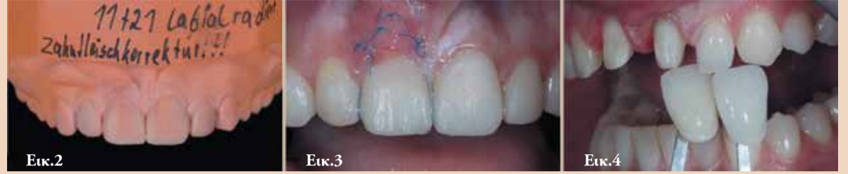
Εικ. 2 Τελειοποιημένο κέρωμα με χειλική διαμόρφωση.

Επιπρόσθετα, οι αποκαταστάσεις ήταν ογκώδεις στην κοπτική περιοχή και δεν ταίριαζαν με τα παρακείμενα δόντια ή το πρόσωπο της νεαρής γυναίκας. Γενικά, οι κεντρικοί τομείς φαινόταν πως είχαν προστομακική απόκλιση