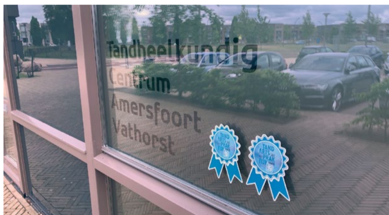
TC Amersfoort Vathorst telt maar liefst zestien verschillende mondzorgdisciplines onder één dak.

“Uiteindelijk bleken we tot de drie finalisten te behoren. De winnaar werd bekendgemaakt tijdens 'Klantpasta!' in Utrecht. Met een groot deel van mijn team ging ik naar de uitreiking. Natuurlijk gingen we voor de winst, maar de twee andere praktijken maakten ook een goede kans. Op onze T-shirtjes hadden we 'de leukste praktijk van Vathorst' laten drukken. Die waren we in ieder geval. Maar of we daadwerkelijk als landelijke winnaar uit de bus zouden komen, moest nog blijken. Er zijn misschien wel 5.000 praktijken in Nederland die voor deze prijs in aanmerking komen.” De drie finalisten werden voorge-