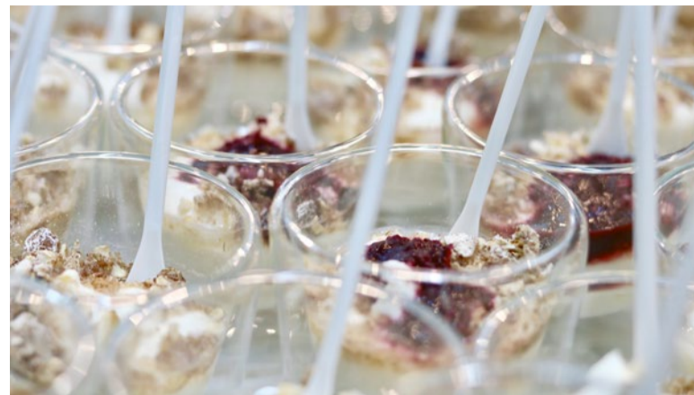
'Tandheelkunde up-to-date': met deze goedbezochte themadag eindigde het seizoen van Quality Practice Tandheelkunde.

Antibiotica-resistentie dreigt in 2050 doodsoorzaak nummer één te worden