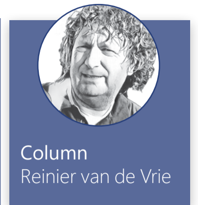
Column Reinier van de Vrie

Van Meijeren vertelt dat ze in tegenstelling tot voorgaande onderzoeken minder heeft gekeken naar de invloed van individueel gedrag op de mondgezondheid, maar meer naar de bredere context waarin kinderen opgroeien. Van Meijeren: "Alleen wonen in een achterstandswijk heeft al een negatieve invloed op het gebit, zelfs na correctie voor verschillende individuele sociaaleconomische kenmerken. Een ongezonde omgeving, met bijvoorbeeld meer fastfoodketens, draagt bij aan ongezonde keuzes. Die voedselomgeving is relevant om mee te nemen voor toekomstig beleid, ook om bijvoorbeeld obesitas te verminderen." Van Meijeren verdedigde op woensdag 15 februari haar proefschrift. "Het was een mooie ceremonie," laat ze weten. "Tijdens de verdediging kreeg ik vooral vragen over de praktische toepasbaarheid van mijn onderzoek, die ik goed kon beantwoorden." Het volledige proefschrift, getiteld From disparity to potential. Nutritional and social determinants of children's oral health , is te lezen via: https://bit.ly/3BQdAPn . ■