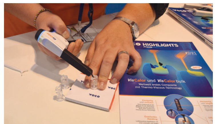
•Produkt demonstration des VisCalor-Komposits. •Product demonstration of the VisCalor composite.

At IDS, we are concentrating on our new VisCalor product. It is the first composite in the world to feature thermally controlled viscosity behaviour. At the last IDS, we presented VisCalor Bulk, so we are now expanding our product range. It is available in various VITA shades, allowing the