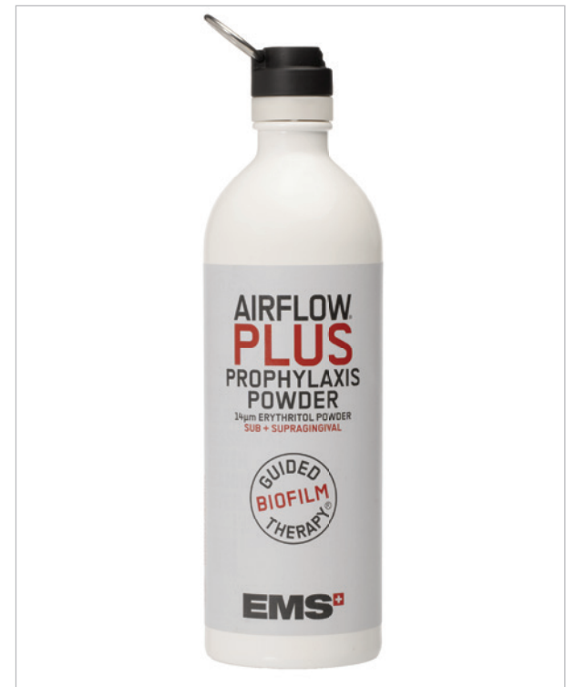
•Das AIRFLOW PLUS Pulver ist neu in einer hochwertigen Aluminiumflasche erhältlich. Diese kann nach Verbrauch als Trinkflasche genutzt werden. •AIRFLOW PLUS powder is now available in a high-quality aluminium bottle, which can be reused for beverages.